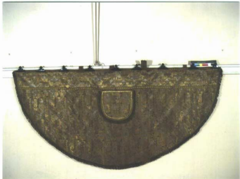
Piviale Ganzo - prima del restauro-