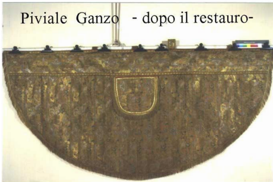
Piviale Ganzo - dopo il restauro-