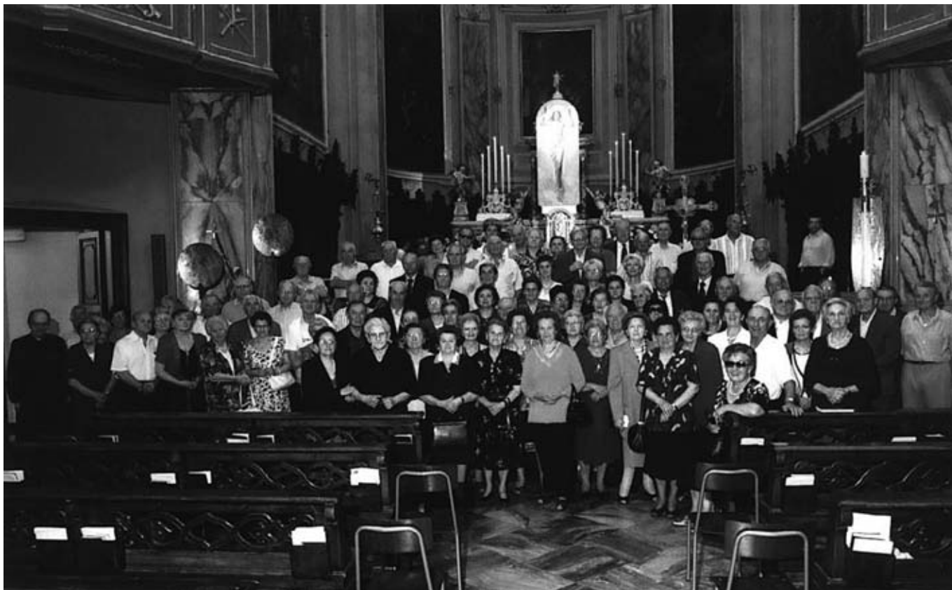
La numerosa compagine della terza età davanti all'altare