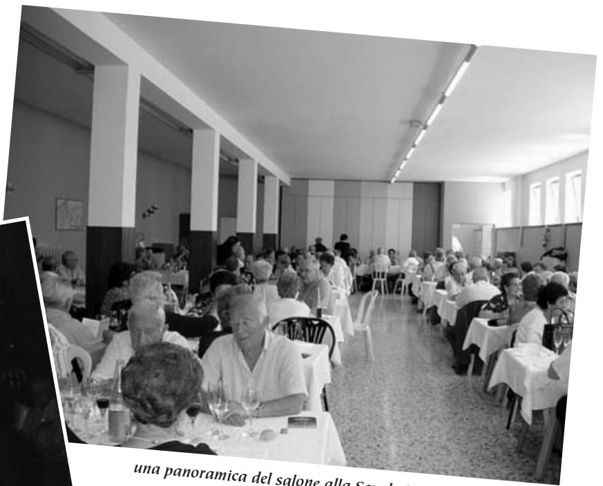
una panoramica del salone alla Scuola Materna