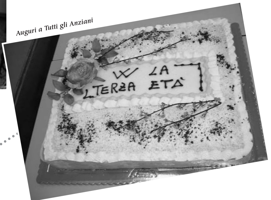
Auguri a Tutti gli Anziani