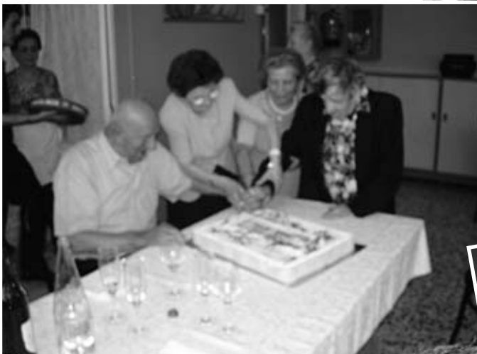
Il taglio della torta da parte dei tre decani