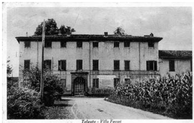
Telgate - Villa Ferrari

mance da bell'epoque in quei saloni affrescati ed in realtà qualcosa di verosimile poteva anche esserci, dato che numerosi personaggi erano stati accolti in quel palazzo e dalle loro memorie scritte emergono lusinghieri commenti per l'ospitalità ricevuta dalla famiglia Ferrari.