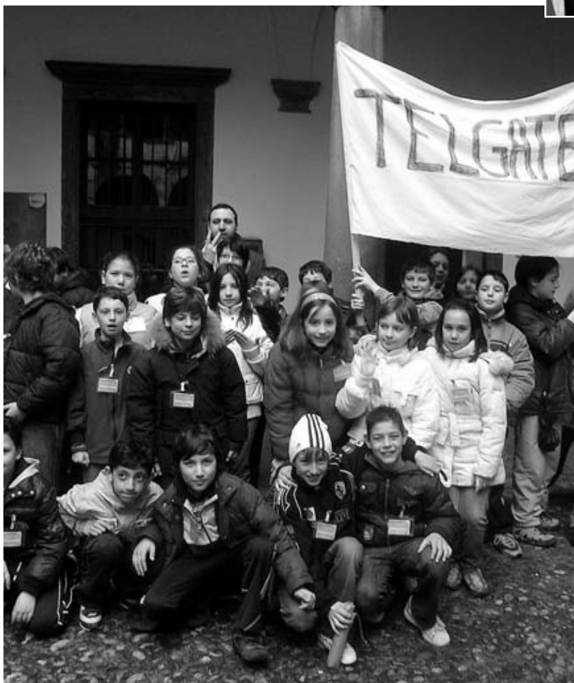
Il gruppo di Telgate