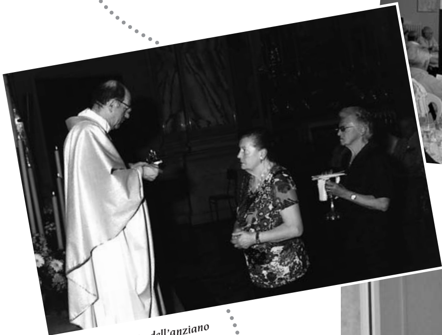
L'omelia per la Festa dell'anziano