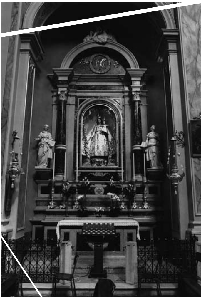
Immagine dell'Altare della Madonna recentemente restaurato. E' stato applicato un mosaico in oro chiaro con tessere in pasta di vetro all'interno della nicchia; sono state restaurate e portate ai lati le due statue lignee di ESTER e GIUDITTA, donne dell'Antico Testamento che rimandano a Maria Santissima. E' stata restaurata la statua della Madonna.

Restano da ultimare alcuni ritocchi alla base delle statue e della nicchia per esaltare il mosaico e mettere in evidenza l'immagine di Maria.