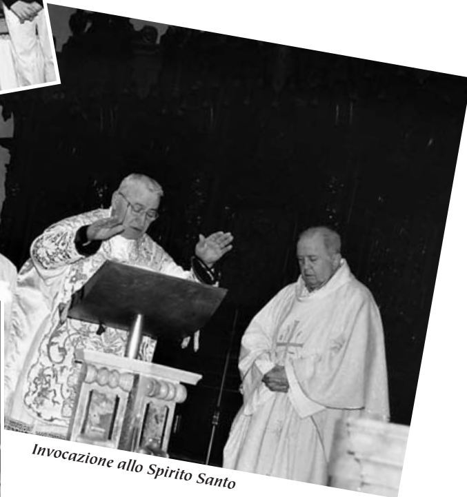
Invocazione allo Spirito Santo