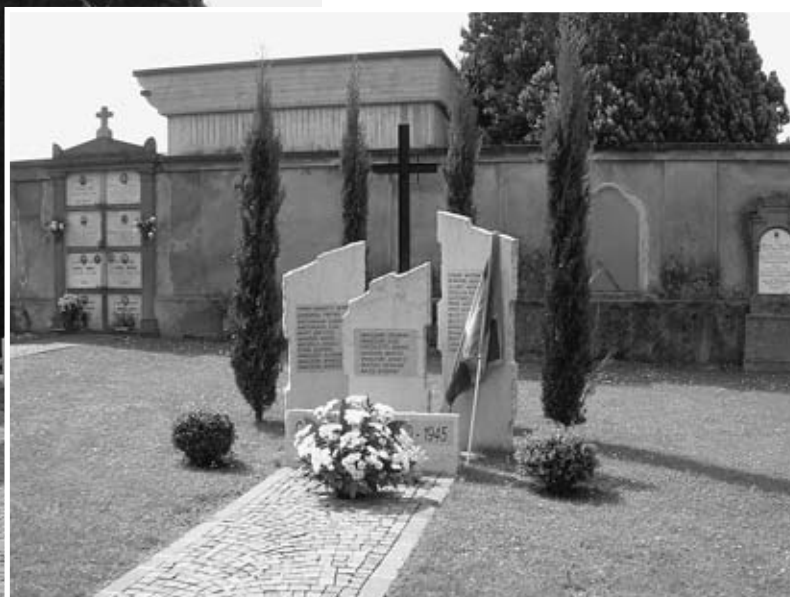
Monumento ai caduti della seconda guerra mondiale