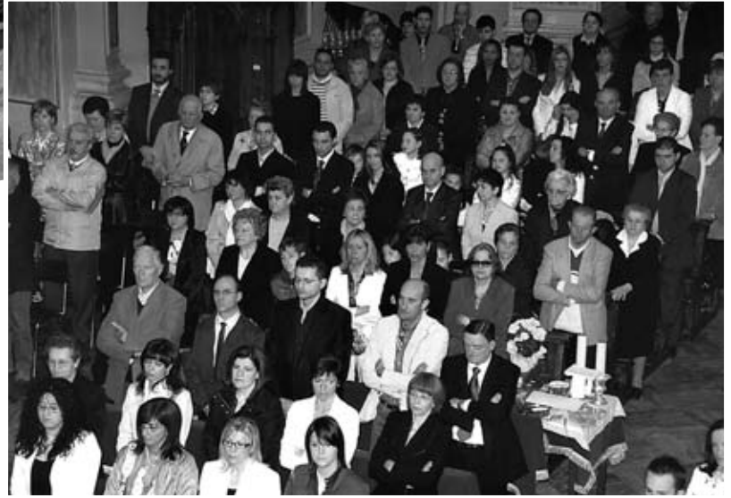
I padrini e i genitori dei ragazzi