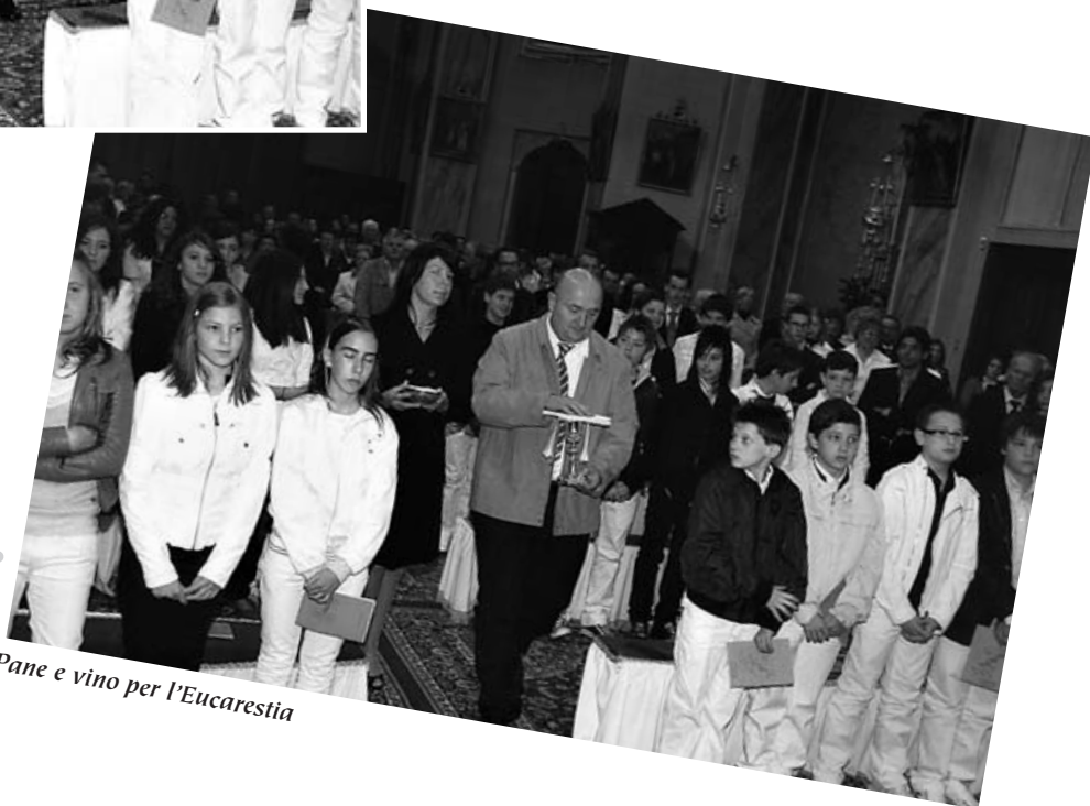
Pane e vino per l'Eucarestia