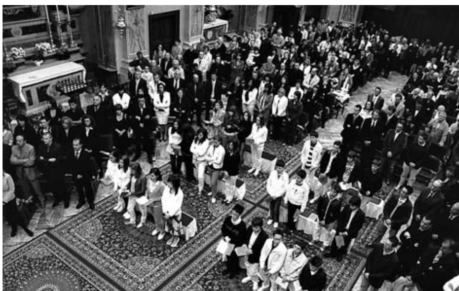
Una panoramica dei ragazzi vista dall'alto