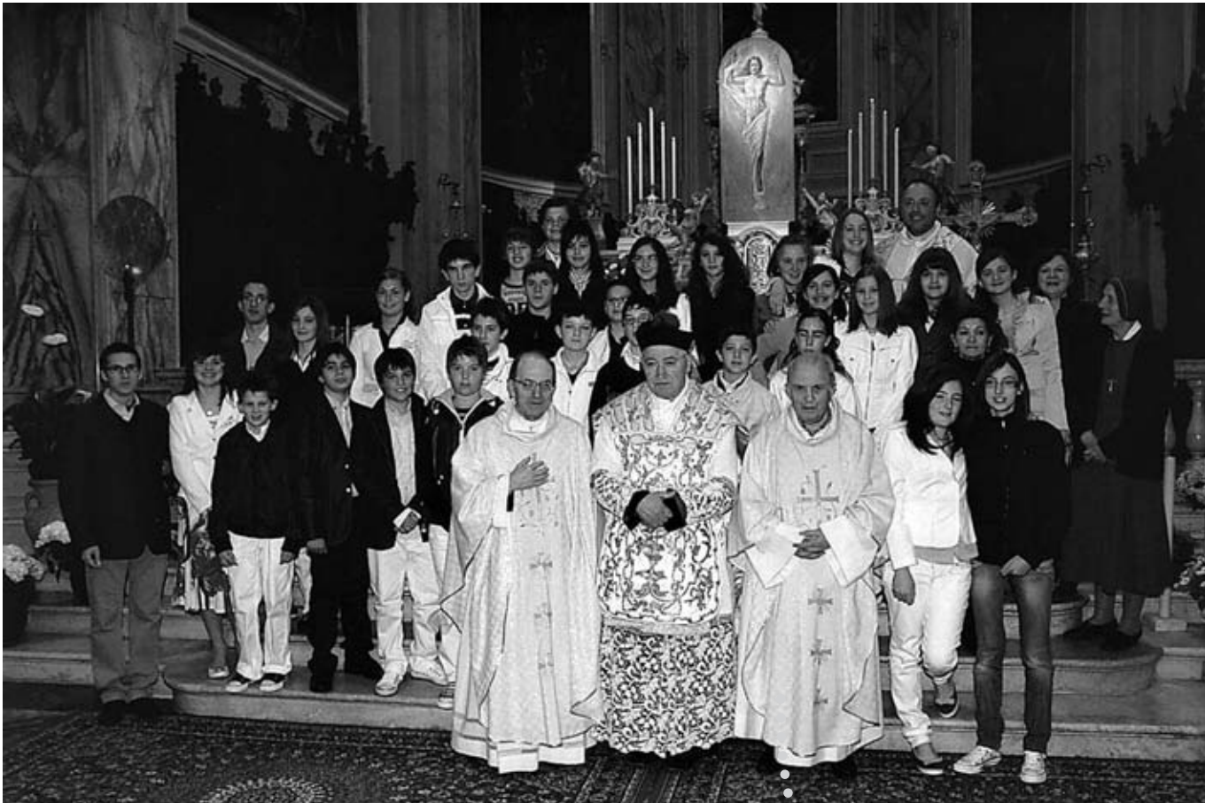
Foto ricordo dei ragazzi cresimati, dei catechisti e Sacerdoti