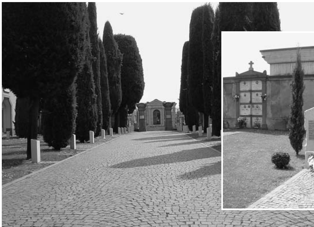
I cipri con i nomi dei caduti della prima guerra mondiale