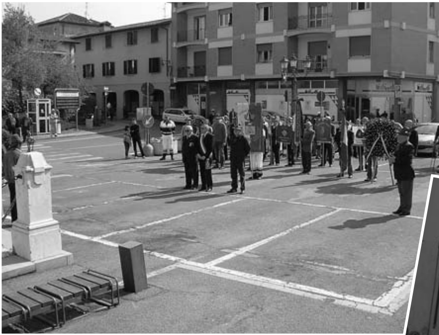
Corona deposta al monumento ai caduti