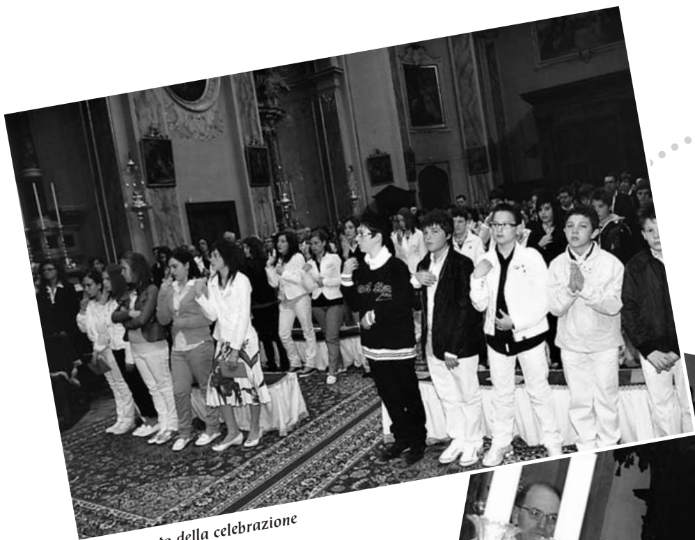
Un momento della celebrazione