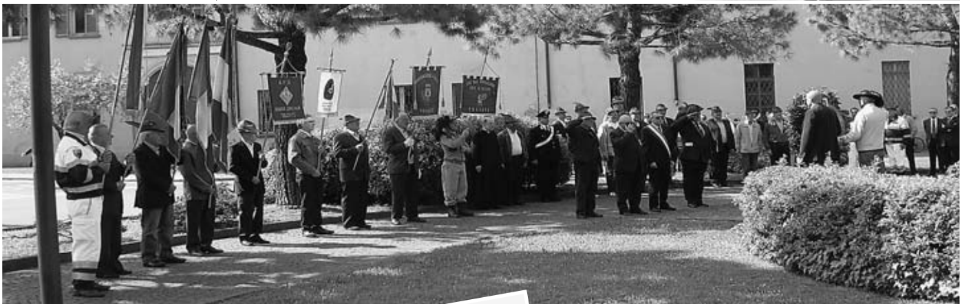
Onore ai caduti di tutte le guerre