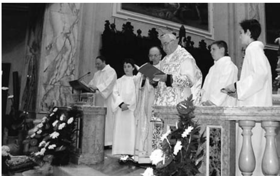
Il rito della S. Cresima