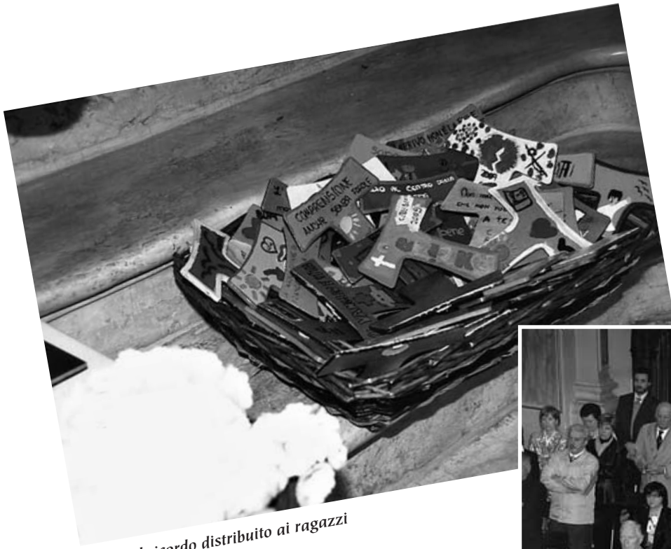
Il ricordo distribuito ai ragazzi