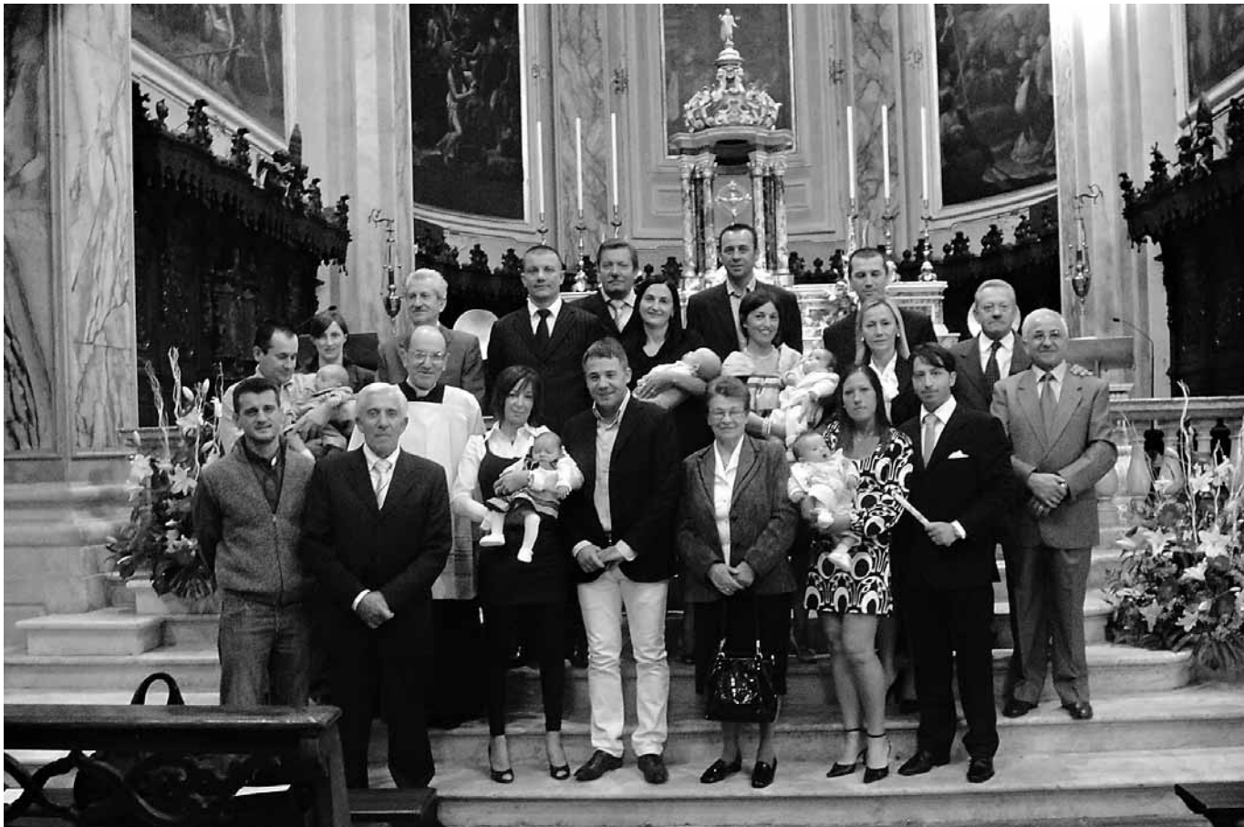
Il gruppo di battezzati di domenica 11 ottobre 2009