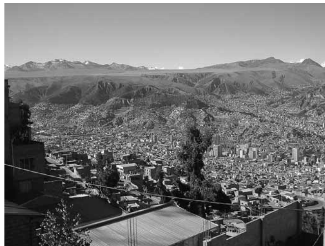
La città di La Paz, Bolivia

Inoltre viaggiare rende più flessibili, apre la mente al nuovo e al diverso e ti aiuta a comprendere che non tutto gira intorno a te!