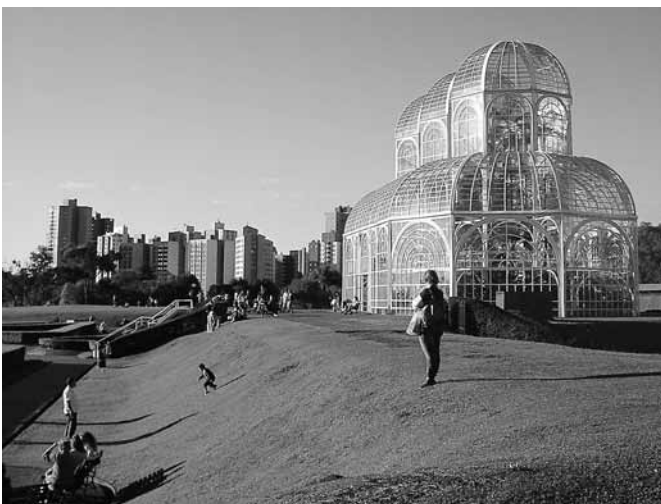
La citt  di Curitiba, Brasile

Quando finalmente siamo entrati in ospedale abbiamo trovato un ambiente molto ospitale ed acco-