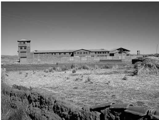
Carcere per minori, progetto Qualauma

gliente, nel senso che sia i medici sia gli studenti brasiliani che abbiamo incontrato hanno cercato subito di farci partecipare alle attività dei vari reparti, mostrandoci diverse pratiche mediche e facendoci anche sperimentare in prima persona.