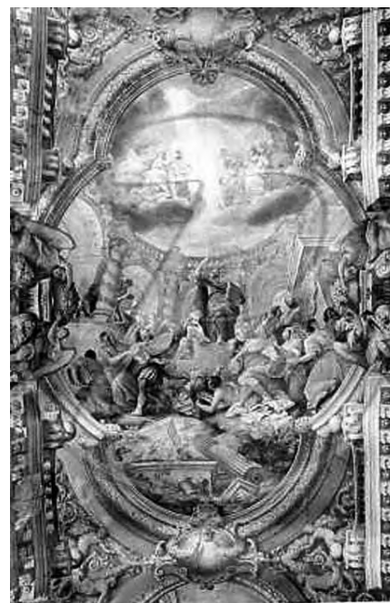
Basilica di San Paolo fuori dalle mura: San Paolo colto mentre svela il volto del Dio ignoto adorato dagli ateniesi. In alto, in un cielo di fulgide luci, si apre la visione della divinità nuova che alle genti stupefatte veniva rivelata.

magari faticosamente, di tradursi in stile di vita coerente con la fede professata, rischia di diventare una maschera; ma la coerenza presuppone chiarezza di idee, forza di convinzioni e grandezza di ideali.