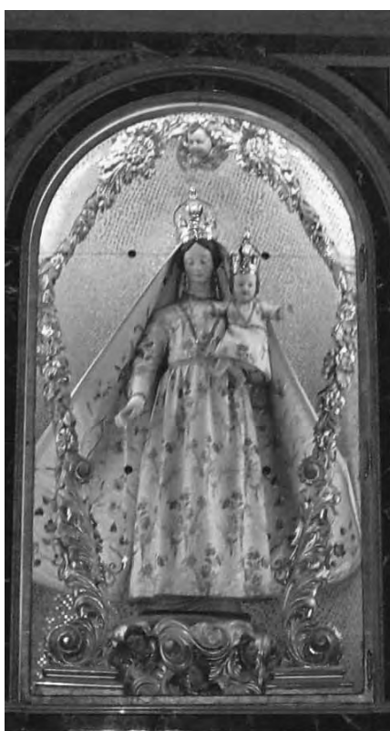
La nicchia dell'altare illuminata