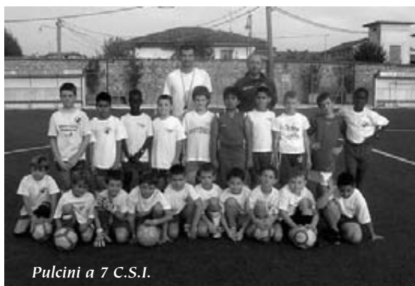
Pulcini a 7 C.S.I.