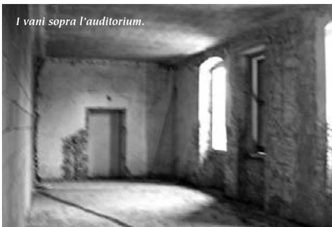
I vani sopra l'auditorium.