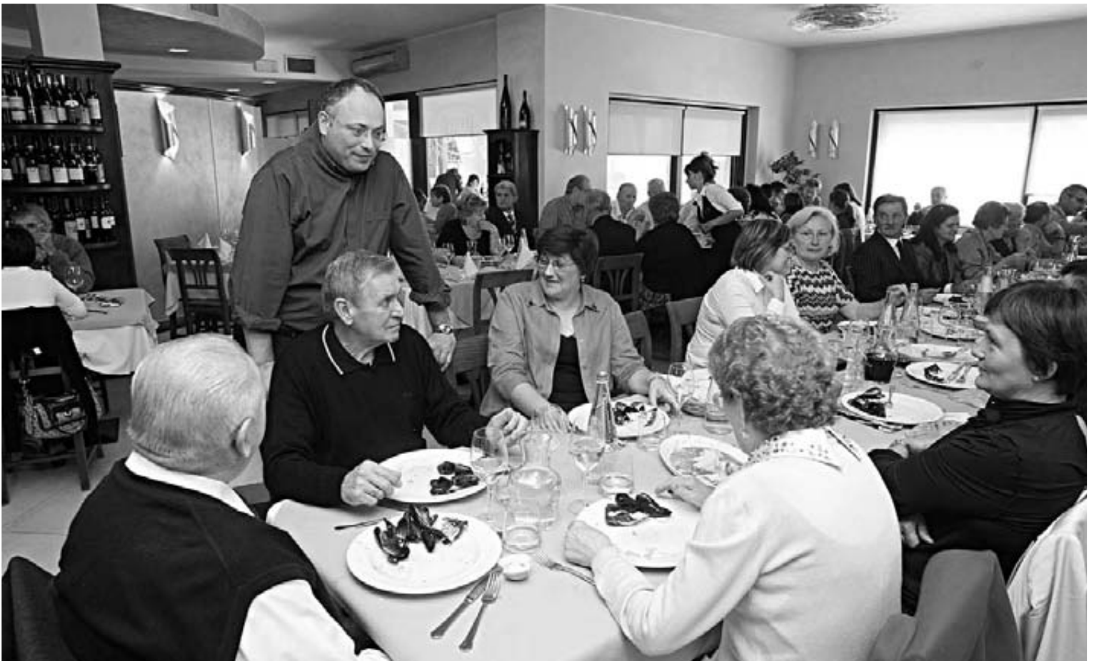
Momenti del pranzo.