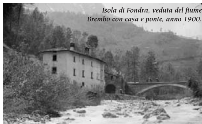
Isola di Fondra, veduta del fiume Brembo con casa e ponte, anno 1900.

I l fiume Brembo nel comune linguaggio dà il nome a tutto il territorio Bergomese; e la valle, entro cui scorre quel fiume, si appella Val Brembana.