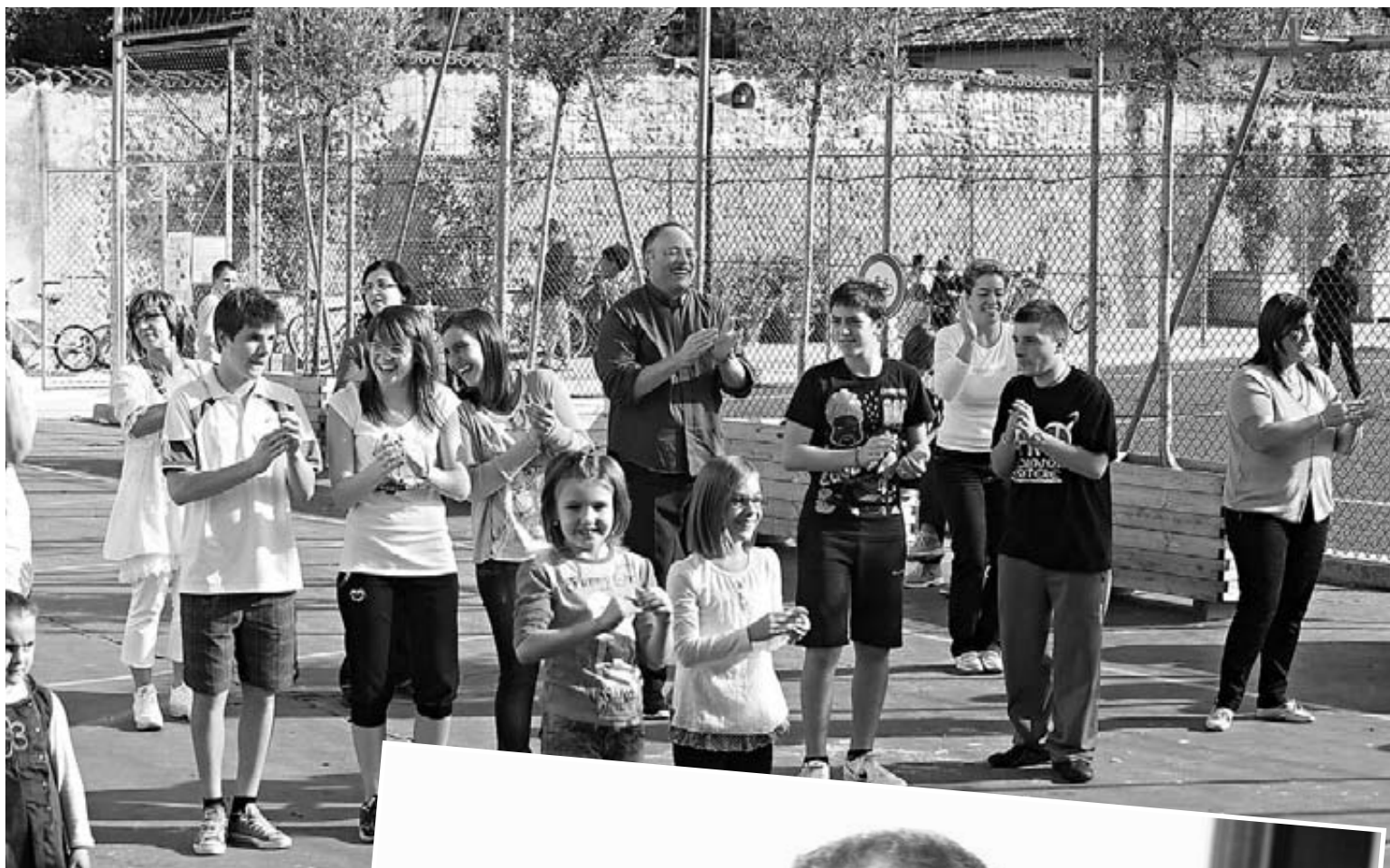
Con i ragazzi del C.R.E.