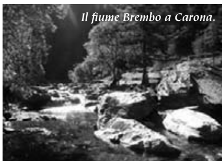
Il fiume Brembo a Carona.