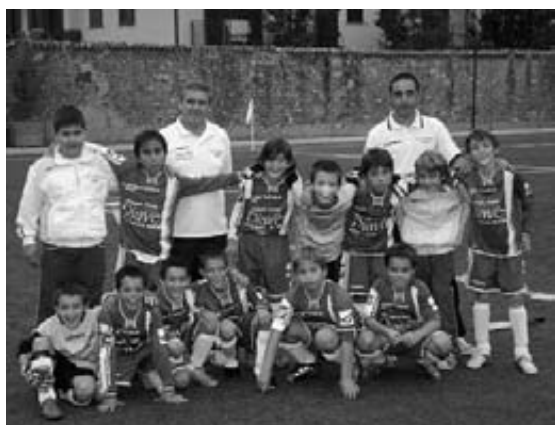
Pulcini a 7 F.I.G.C.

Ringraziamo l'amministrazione comunale per questa opportunità e non deluderemo quanti hanno avuto fiducia in noi mantenendo la struttura efficiente e funzionale.