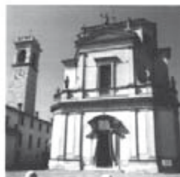
Parrocchia San Giovanni Battista Telgate