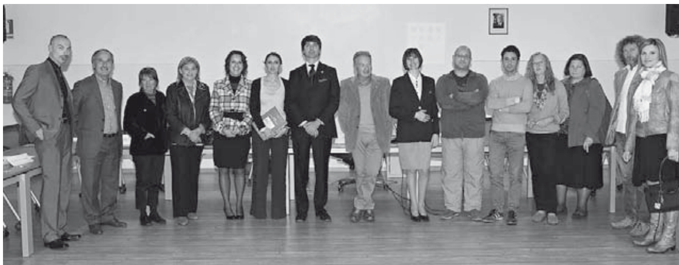
Foto di gruppo dei relatori ritratti con il sindaco di Telgate