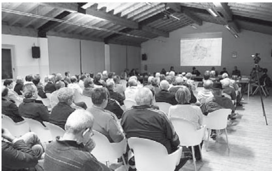
Una panoramica del convegno del 14 ottobre scorso tenutosi presso il centro polivalente mons. Biennati