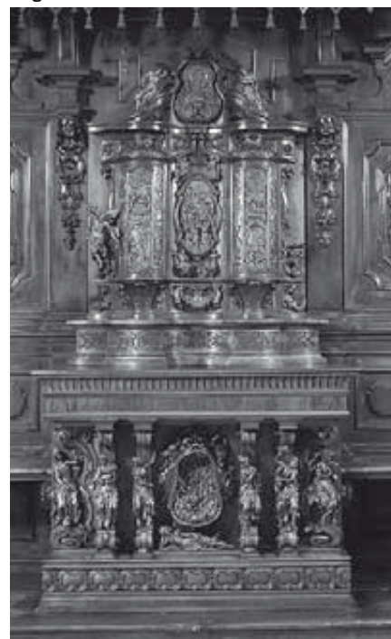
Inginocchiatoio Piccini, Chiesa Parrocchiale di Telgate

allora, non sia solo occasione di arricchimento culturale - anche questo - ma soprattutto possa diventare un momento di grazia, di stimolo per rafforzare il nostro legame e il nostro dialogo con il Signore, per fermarsi a contemplare il raggio di bellezza che ci colpisce, che quasi ci "ferisce" nell'intimo e ci invita a salire verso Dio. Finisco con la preghiera di un Salmo: "Una cosa ho chiesto al Signore, questa sola io cerco: abitare nella casa del Signore tutti i giorni della mia vita, per contemplare la bellezza del Signore e ammirare il suo santuario". Speriamo che il Signore ci aiuti a contemplare la sua bellezza, sia nella natura che nelle opere d'arte, così da essere toccati dalla luce del suo volto, perché anche noi possiamo essere luci per il nostro prossimo. Grazie