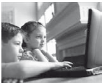
Bambini al pc

« Mi piace pensare con don Enzo Boschetti (fondatore della Comunità casa del giovane di Pavia con una causa di beatificazione in corso ndr.) che saranno i ragazzi a salvare i ragazzi».