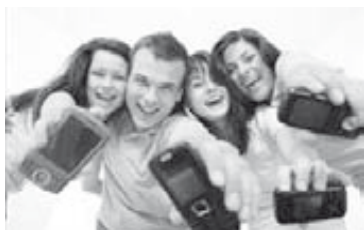
Ragazzi iperconnessi.

«Il 27% dei ragazzi italiani si dà appuntamento con persone conosciute in Rete. Da queste evidenze e dal nostro lavoro quotidiano con i ragazzi emerge chiaramente come sia necessario dar loro strumenti tecnici e