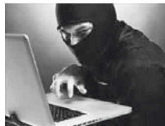
I reati viaggiano anche in Rete.