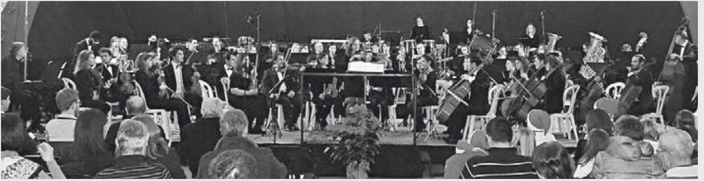
8 dicembre - Il Corpo Musicale "Telgate90" e gli archi della New Pop Orchestra durante il concerto di Natale