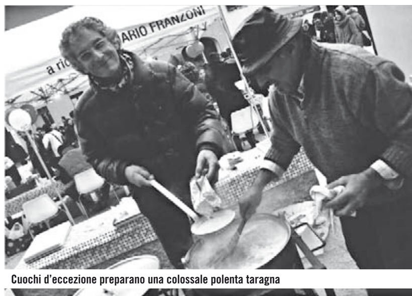
Cuochi d'eccezione preparano una colossale polenta taragna