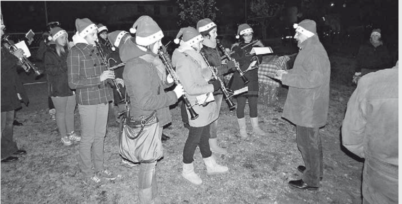
20 dicembre - La Walking Band "Telgate 90" durante le Pastorali in Via Geri.