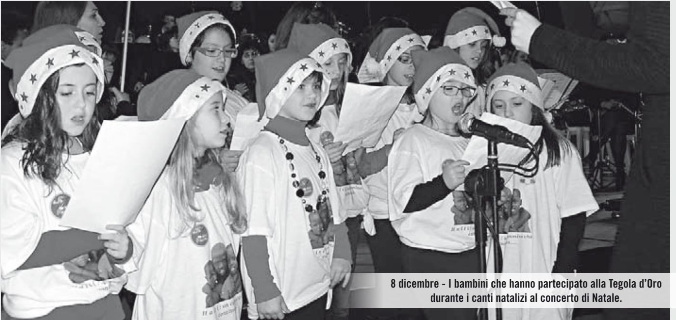
8 dicembre - I bambini che hanno partecipato alla Tegola d'Oro durante i canti natalizi al concerto di Natale.