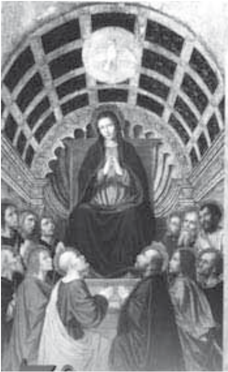
La Pentecoste, pala del Bergognone nella Chiesa di S. Spirito a Bergamo

Vento che si abbatte gagliardo e fuoco che si propaga veloce; sono i segni esteriori con i quali si manifesta il dono dello Spirito Santo a Pentecoste. Ma quel vento e quel fuoco hanno effetti tutt'altro che devastanti.