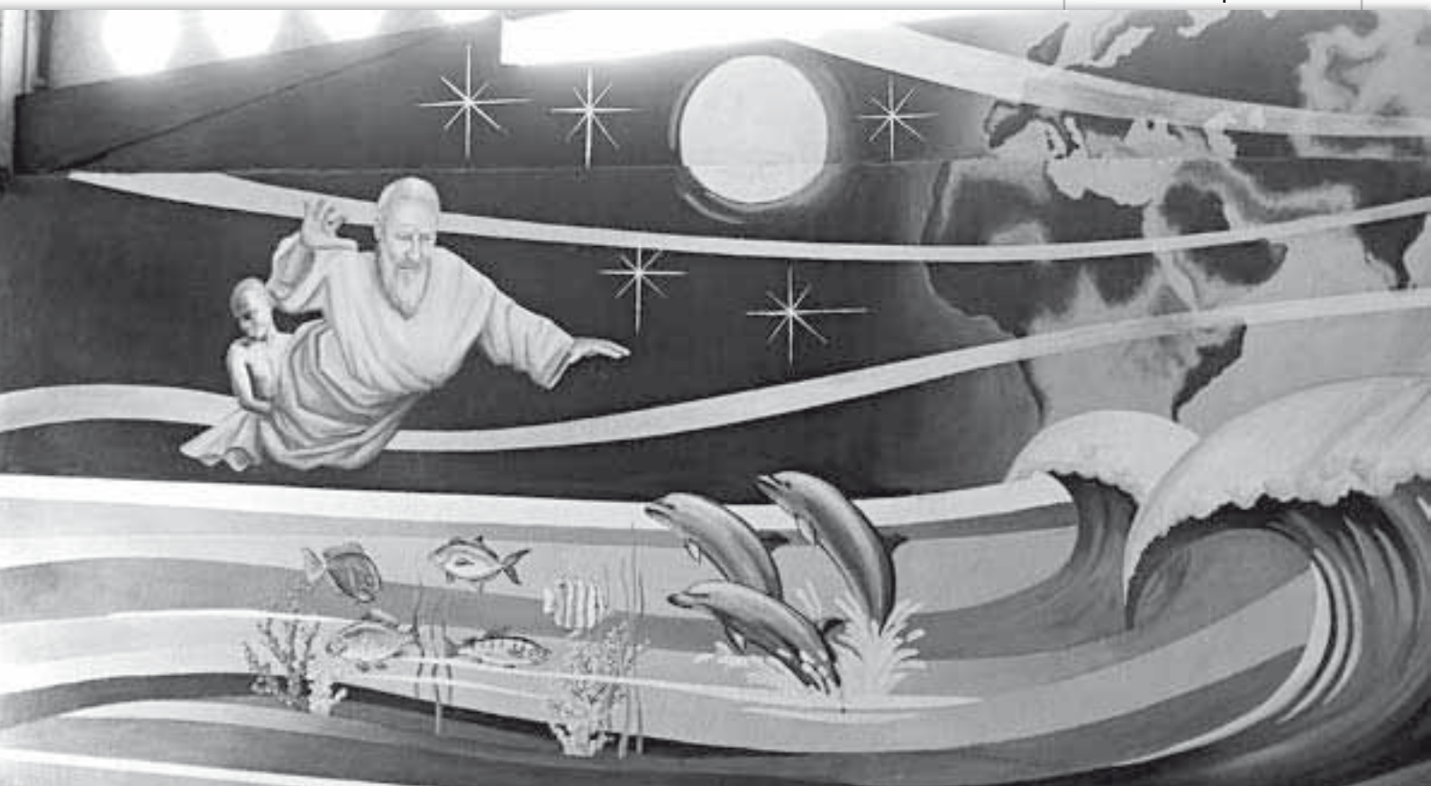
La creazione dei pesci nel mare