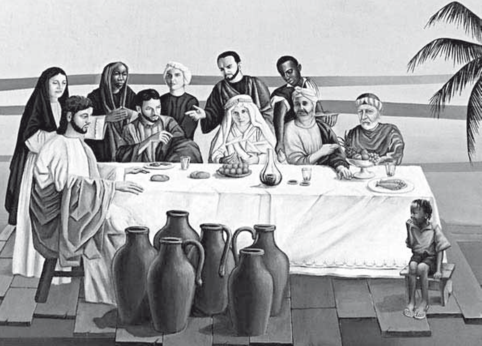
Le nozze di Cana