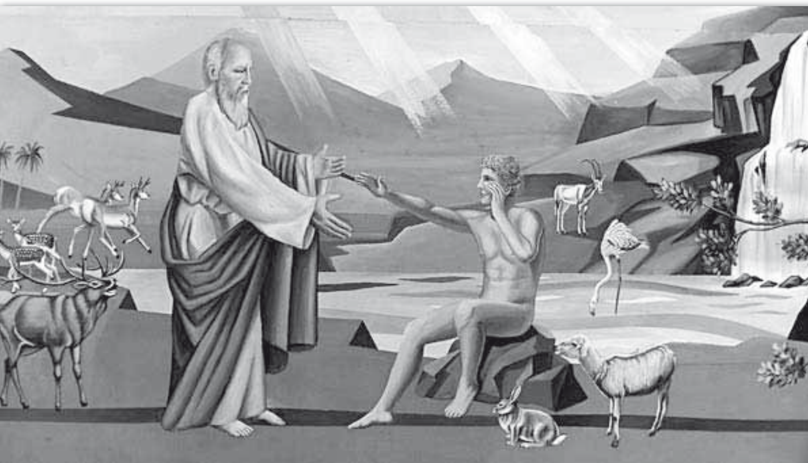
La Creazione di Adamo