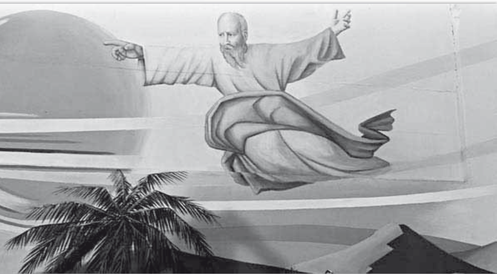
La creazione del Sole e della luce