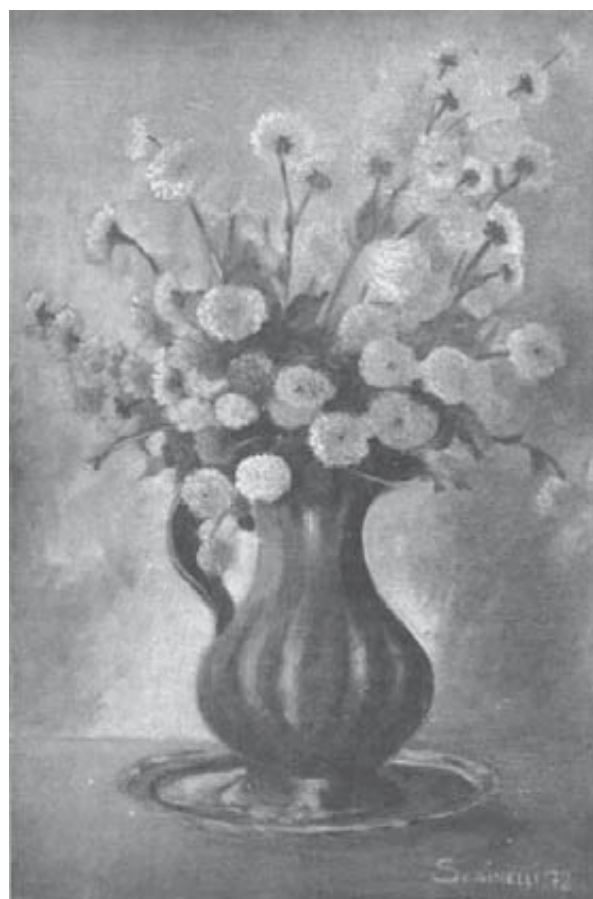
Antora di peltro con fiori