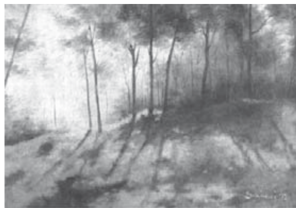
Autunno in controluce