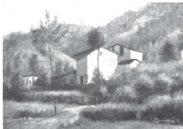
Selino - Valle Imagna (scorcio)