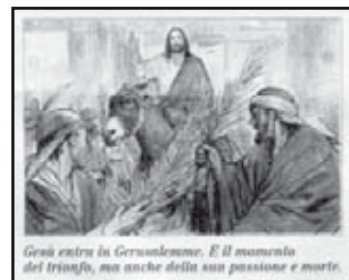
Gesù entra in Gerusalemme. È il momento del trionfo, ma anche della sua passione e morte.

NB - Si veda nell'apposito spazio per la Settimana Santa e la Pasqua