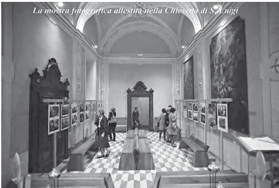
La mostra fotografica allestita nella Chiesa di S. Luigi

sua casa natale, i luoghi della sua infanzia e la casa da lui abitata nei periodi di vacanza, ora trasformata in museo. Abbiamo così simbolicamente restituito la visita alla nostra comunità. A memoria della presenza di Papa Roncalli all'Incoronazione del S. Crocifisso abbiamo consegnato a Mons. Loris Capovilla, suo segretario personale dal patriarcato di Venezia fino alla morte, un album di foto che riproducono le foto che testimoniano la presenza del futuro Papa alle celebrazioni del 1937. L'album andrà ad arricchire la già copiosa documentazione fotografica su Giovanni XXIII.