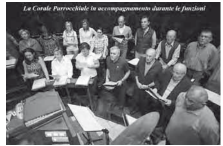
La Corale Parrocchiale in accompagnamento durante le funzioni