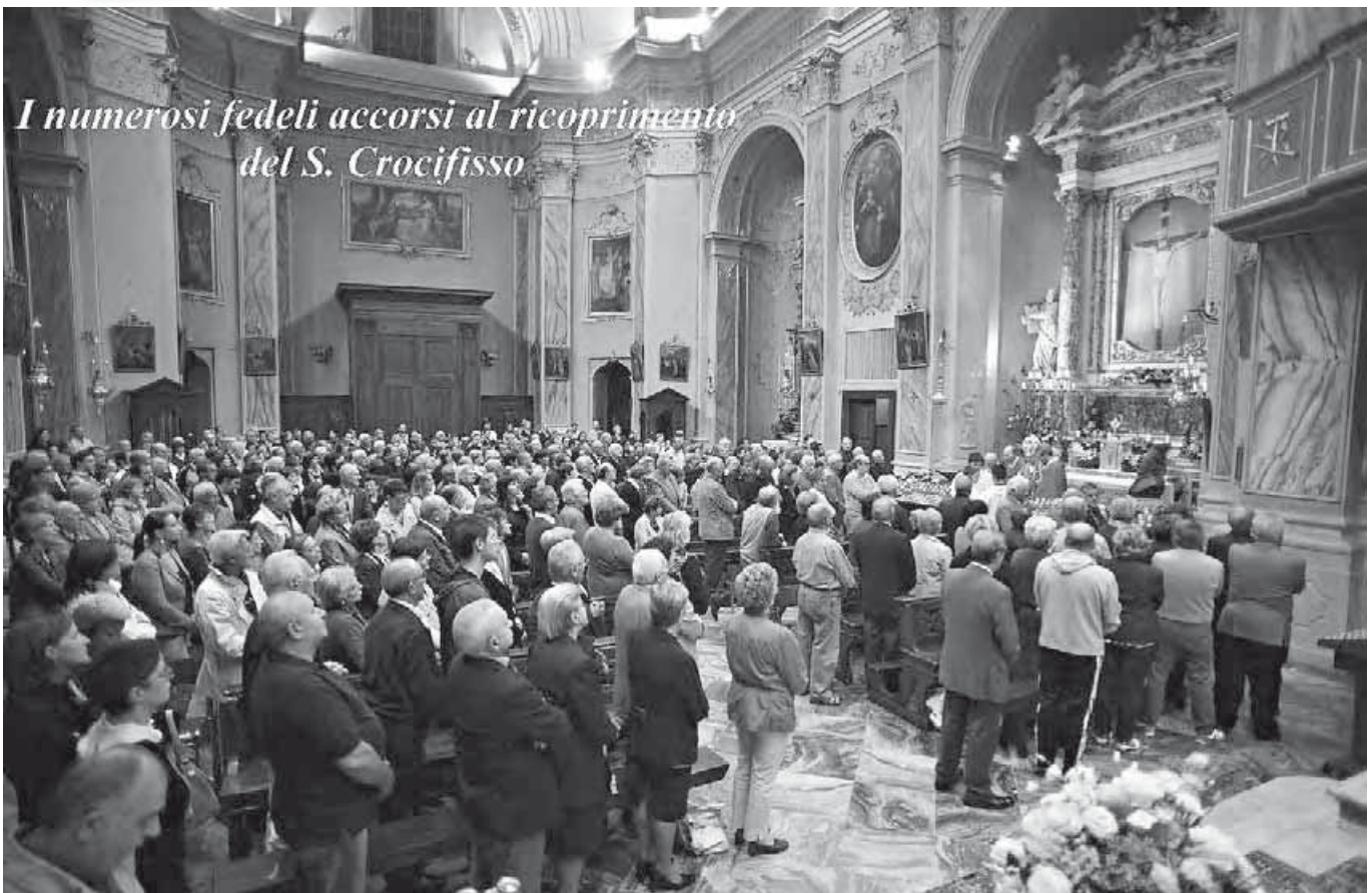
I numerosi fedeli accorsi al ricoprimento del S. Crocifisso

Non poteva, tuttavia, mancare un particolare pensiero a Papa Giovanni; la nostra riconoscenza si è manifestata domenica 23 settembre allorché circa 150 persone si sono recate in pellegrinaggio a Sotto il Monte, suo paese natio, e hanno visitato la