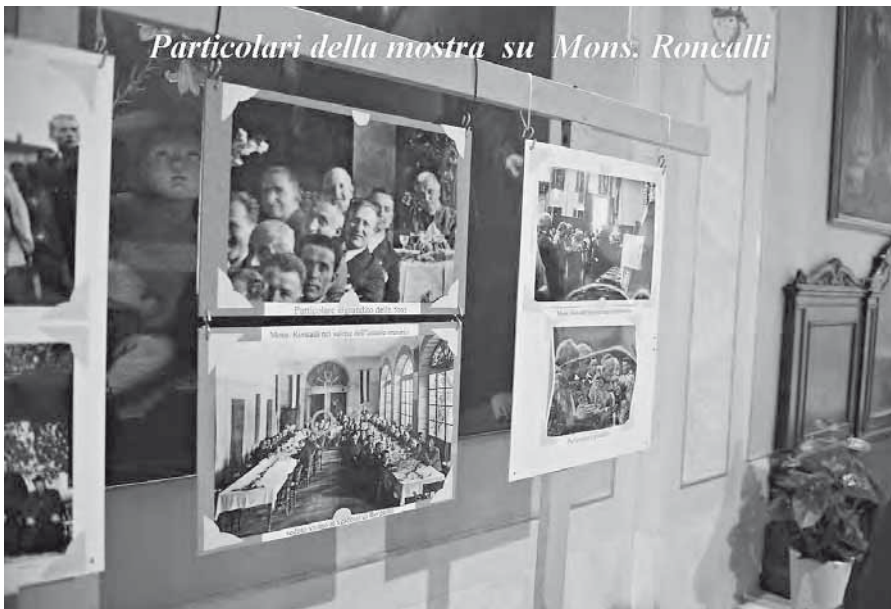
Particolari della mostra su Mons. Roncalli

sua casa natale, i luoghi della sua infanzia e la casa da lui abitata nei periodi di vacanza, ora trasformata in museo. Abbiamo così simbolicamente restituito la visita alla nostra comunità. A memoria della presenza di Papa Roncalli all'Incoronazione del S. Crocifisso abbiamo consegnato a Mons. Loris Capovilla, suo segretario personale dal patriarcato di Venezia fino alla morte, un album di foto che riproducono le foto che testimoniano la presenza del futuro Papa alle celebrazioni del 1937. L'album andrà ad arricchire la già copiosa documentazione fotografica su Giovanni XXIII.