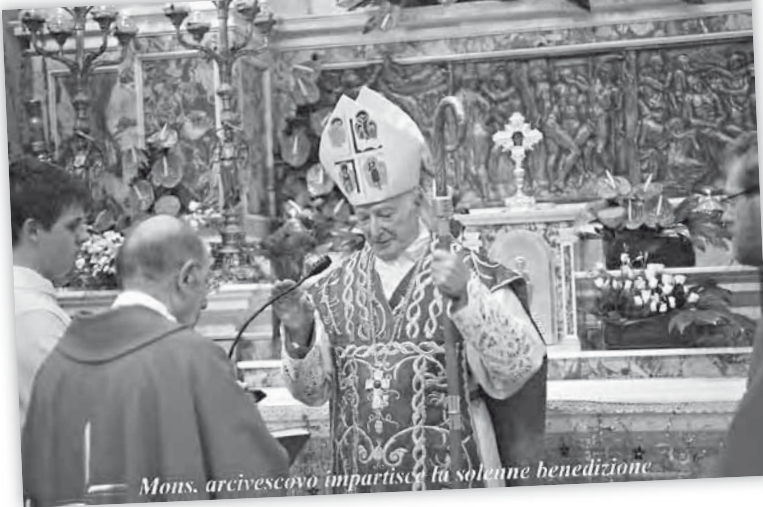
Mons. arcivescovo impartisce la solenne benedizione

traggono il Vescovo Mons. Angelo Giuseppe Roncalli, mentre celebra, predica e sorregge la reliquia della Santa Croce sotto il baldacchino durante la solenne processione.