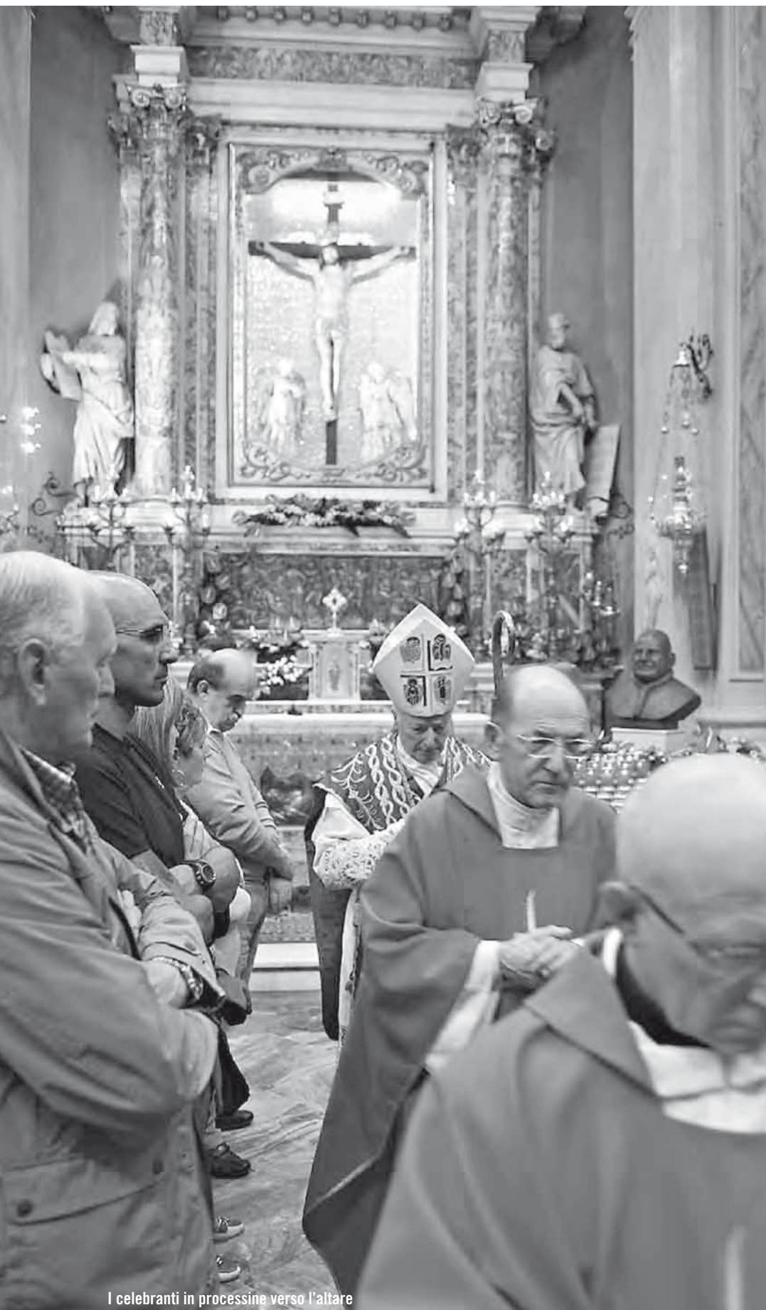
I celebranti in processione verso l'altare

In silenzio contemplavano la sacra immagine del S. Crocifisso incoronato, raccolti in preghiera anziani, giovani, gruppi familiari e fanciulli accompagnati da genitori e nonni. Gente venuta anche da fuori, magari telgate-si che non hanno saputo stare lontani dal paese d'origine e che sono ritornati a vedere e salutare "ol Santo Crobefess de' Telgàt" Tutto ciò è buon segno! La fede coltivata fin da piccoli si trova innervata nell'età adulta e non tarda a far sentire i suoi benefici effetti di grazia.