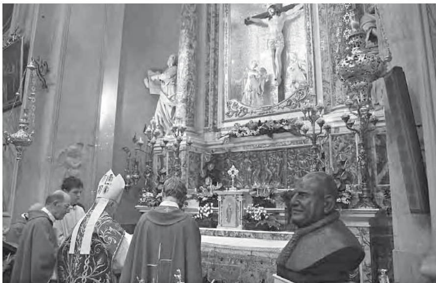
Il busto in bronzo di Papa Roncalli di fianco all'altare del S. Crocifisso

Il 19 settembre del 1937 resterà nella nostra comunità una data storica; e la ricorrenza che abbiamo celebrato lo scorso mese con estrema sobrietà ma con intensità di fede ci ha sorpreso non poco. Con vero stupore, durante i tre giorni di straordinaria esposizione del Santo Crocifisso, s'è potuto notare, nonostante fossero giornate lavorative, un succedersi continuo di persone in religioso silenzio, con lo sguardo fisso al Crocifisso, in un misterioso dialogo "cuore a Cuore"; il cuore della persona devota aperto per manifestare al Crocifisso quanto "sta a cuore"; il Cuore del Crocifisso sempre aperto, come fontana zampillante per la vita eterna, per riversare su chi volge lo sguardo fiducioso verso di Lui le sue grazie e il dono del suo Spirito di consolazione.