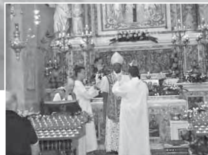
La solenne cerimonia di scoprimento del S. Crocifisso

Il 19 settembre del 1937 resterà nella nostra comunità una data storica; e la ricorrenza che abbiamo celebrato lo scorso mese con estrema sobrietà ma con intensità di fede ci ha sorpreso non poco. Con vero stupore, durante i tre giorni di straordinaria esposizione del Santo Crocifisso, s'è potuto notare, nonostante fossero giornate lavorative, un succedersi continuo di persone in religioso silenzio, con lo sguardo fisso al Crocifisso, in un misterioso dialogo "cuore a Cuore"; il cuore della persona devota aperto per manifestare al Crocifisso quanto "sta a cuore"; il Cuore del Crocifisso sempre aperto, come fontana zampillante per la vita eterna, per riversare su chi volge lo sguardo fiducioso verso di Lui le sue grazie e il dono del suo Spirito di consolazione.