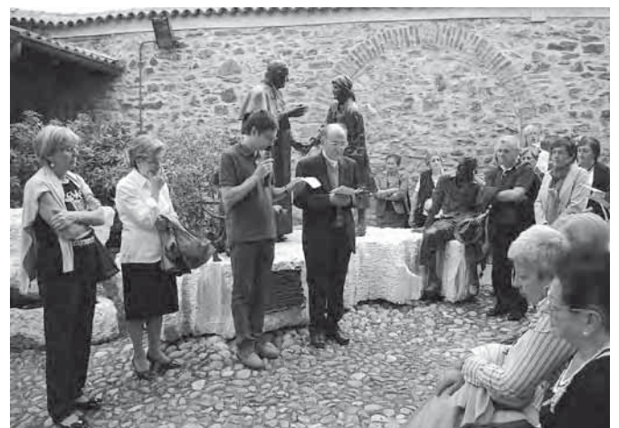
Una preghiera e riflessione a Sotto il Monte