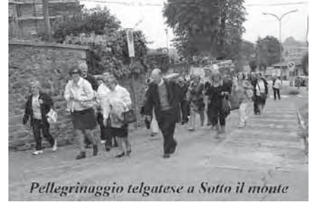
Pellegrinaggio telgatese a Sotto il monte