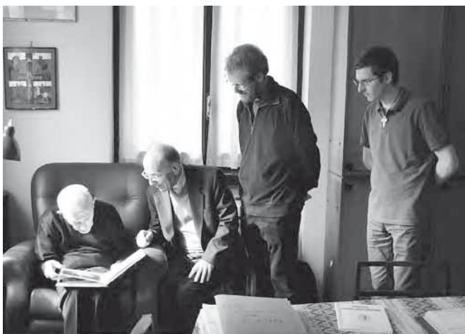
Mons Loris Capovilla osserva le foto dell'album celebrativo dell'incoronazione avvenuta 75 anni fa