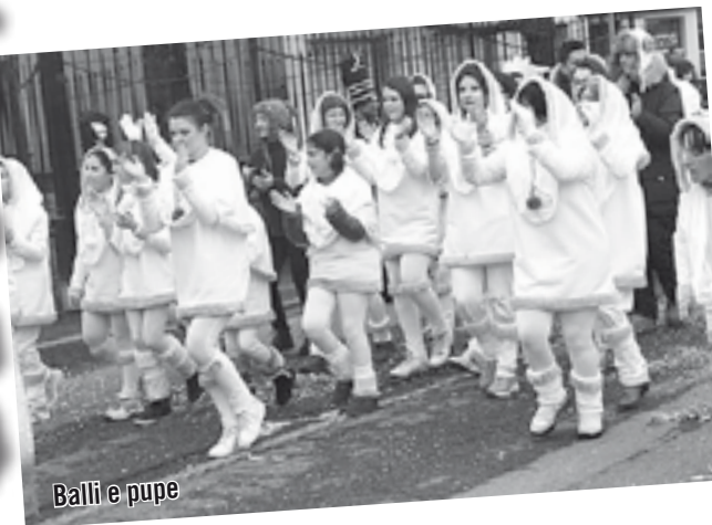
Balli e pupe