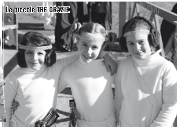
Le piccole TRE GRAZIE