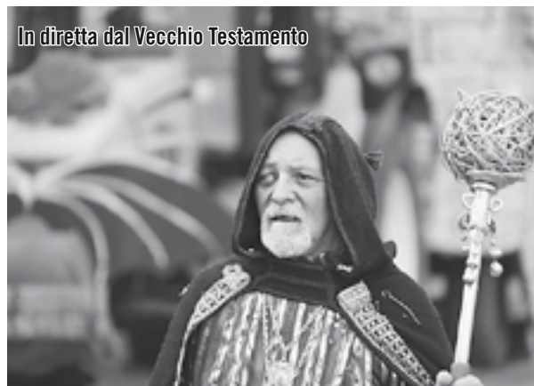
In diretta dal Vecchio Testamento