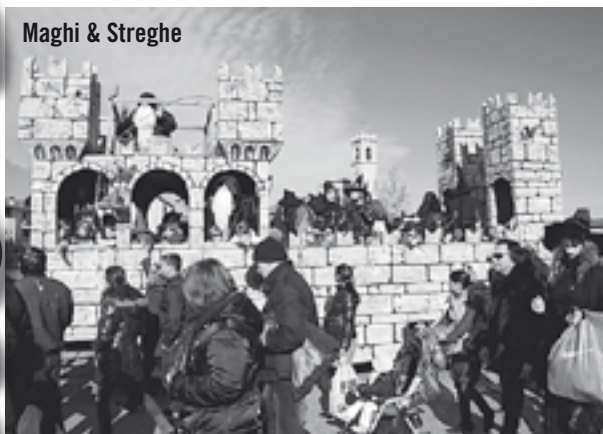
Maghi & Streghe