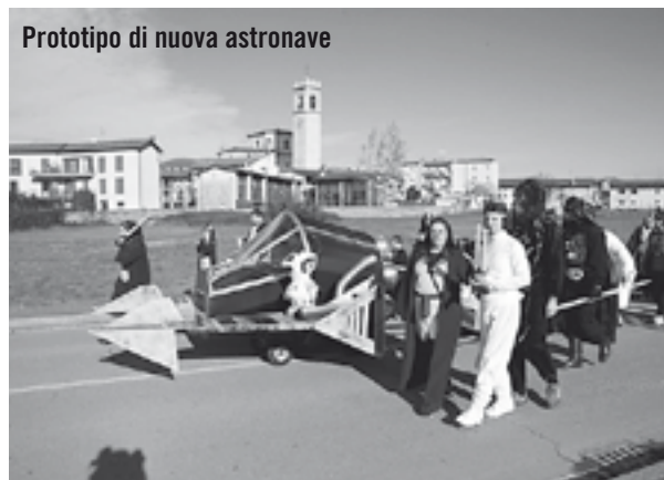
Prototipo di nuova astronave