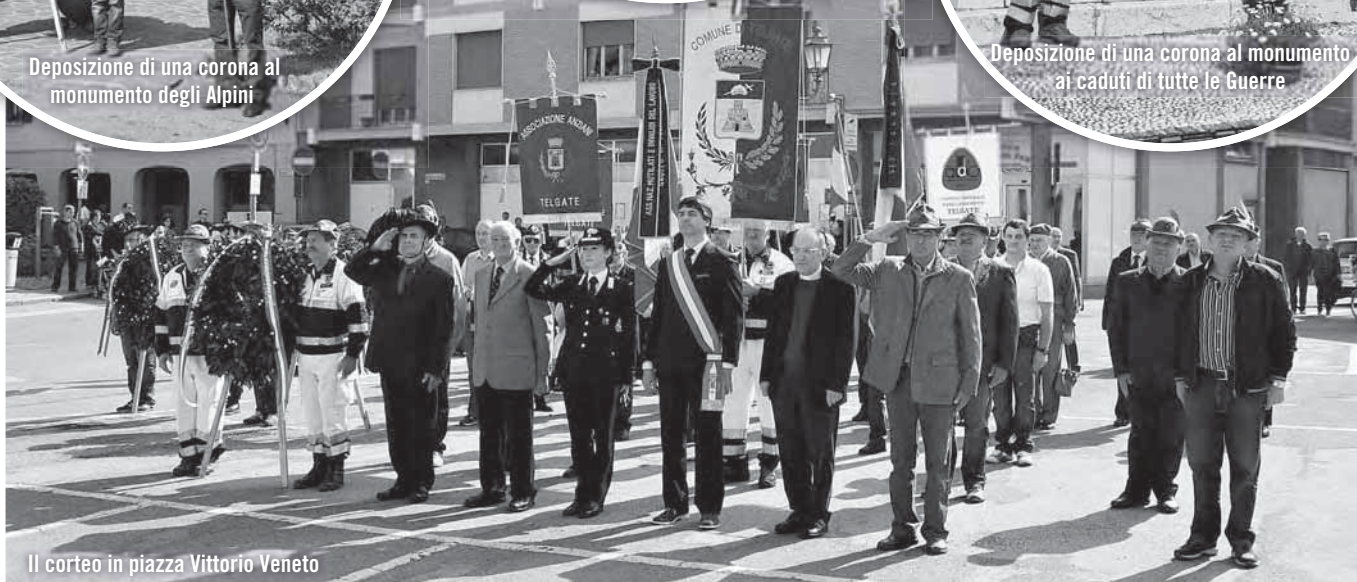
Il corteo in piazza Vittorio Veneto

Una tiepida mattinata di sole ha permesso di celebrare questa ricorrenza in questo primo scorcio di primavera pervaso da molte (troppe) giornate di pioggia che hanno bagnato le feste d'aprile come non mai. Il ricordo di questo avvenimento che sta alle fondamenta del nostro attuale sistema democratico-parlamentare, trova sempre un fidato seguito in tutti coloro che hanno avuto modo di ascoltare e magari di vivere quelle circostanze