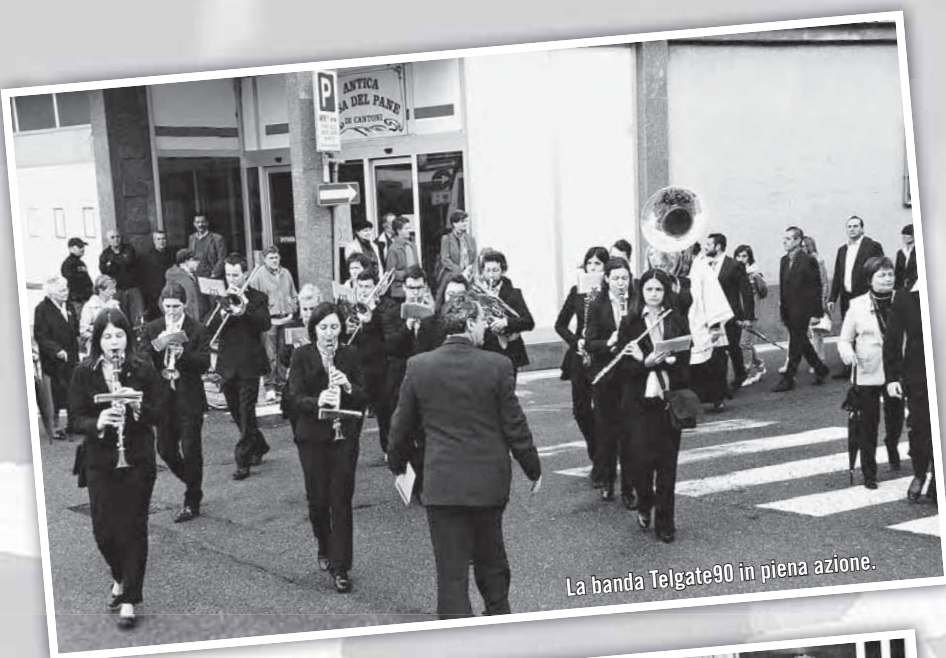
La banda Telgate90 in piena azione.

A tutti voi cari ragazzi ogni più gioiosa fiducia riposta nell'Amore del Risorto!