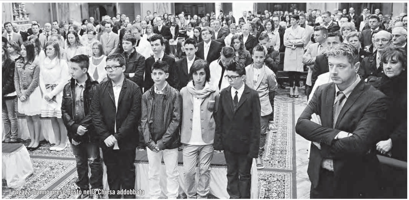
I ragazzi hanno preso posto nella Chiesa addobbata