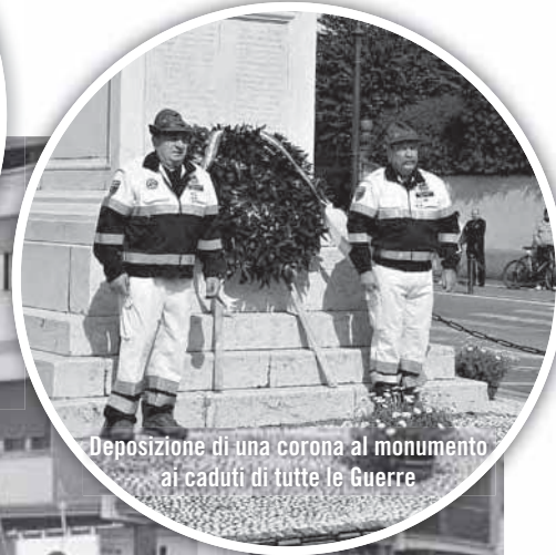
Deposizione di una corona al monumento ai caduti di tutte le Guerre