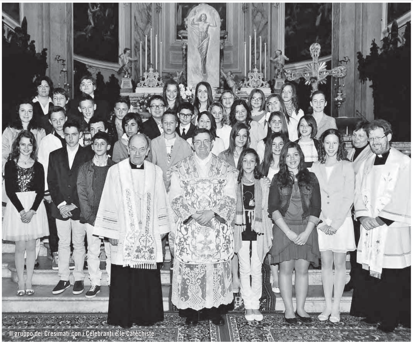
Il gruppo dei Cresimati con i Celebranti e le Catechiste