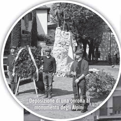
Deposizione di una corona al monumento degli Alpini