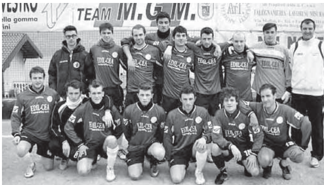
DILETTANTI A 11 CSI TELGATE B: 7° CLASSIFICATI