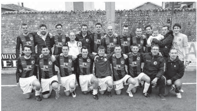
DILETTANTI A 11 CSI TELGATE A: 7° CLASSIFICATI

ALLENATORI: MAURIZIO BONASSI - DIEGO BOCCARDELLI - DAVIDE BONASSI