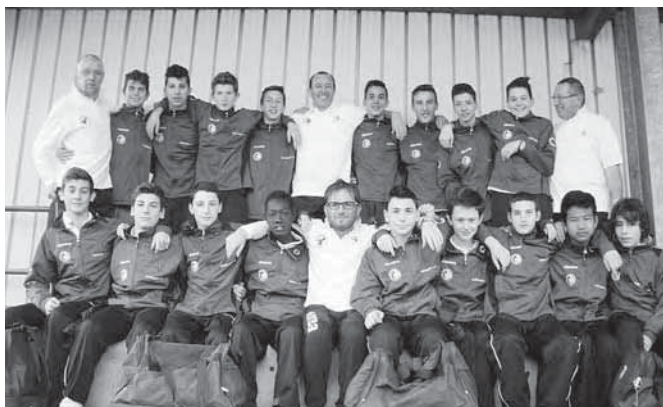
GIOVANISSIMI A 11 FIGC: 1° CLASSIFICATI