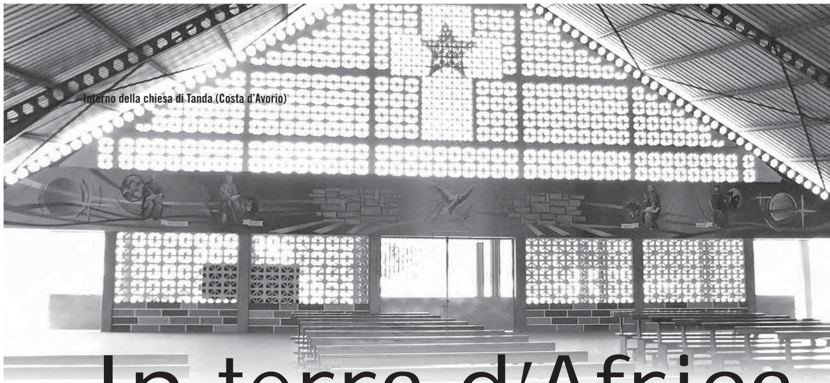
Interno della chiesa di Tanda (Costa d'Avorio)