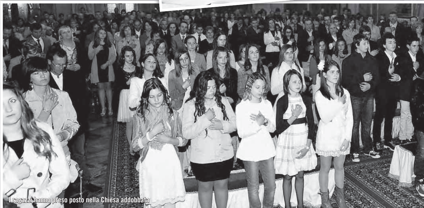
I ragazzi hanno preso posto nella Chiesa addobbata