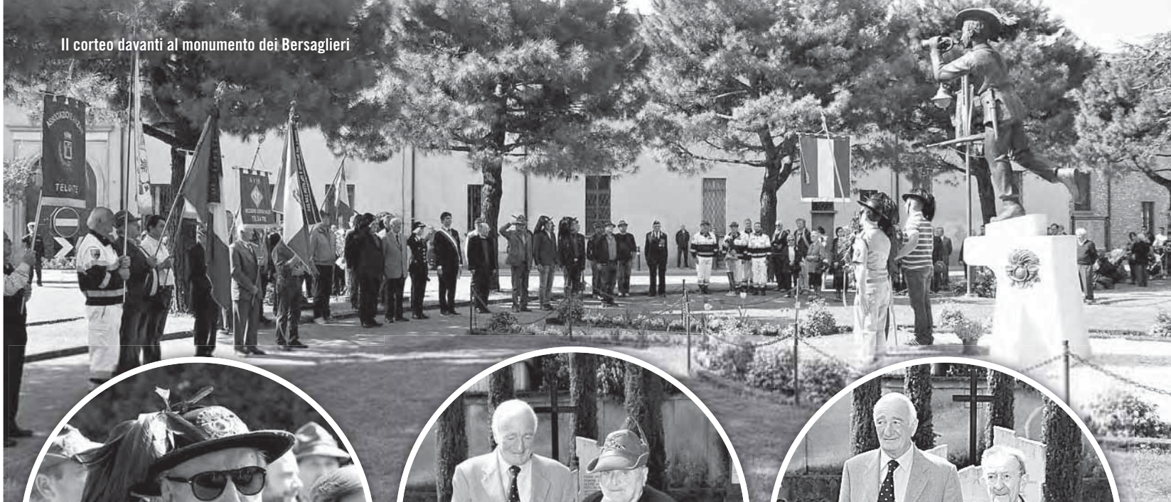
Il corteo davanti al monumento dei Bersaglieri