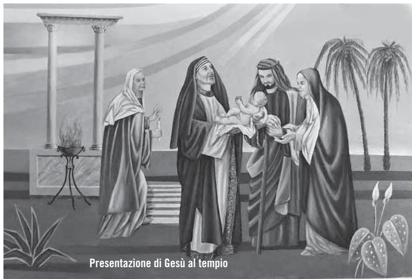
Presentazione di Gesù al tempio