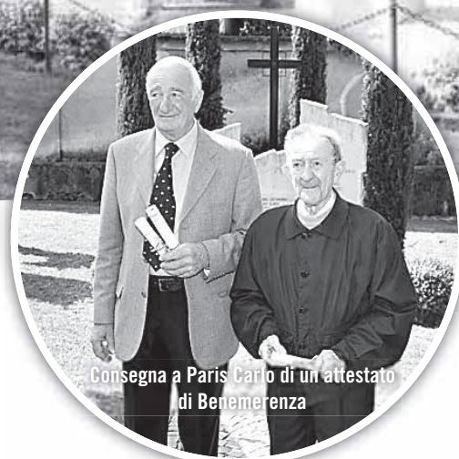
Consegna a Paris Carlo di un attestato di Benemerita

piazzetta degli Alpini con Sindaco in testa, accompagnato da alcuni Carabinieri della locale stazione di Grumello, ha raggiunto la Piazza V. Veneto per la deposizione di corone ai monumenti dei Caduti e degli Alpini, ritmato dal suono della nostra Banda Telgate 90. L'alza Bandiera con l'intonazione dell'Inno Nazionale e gli squilli di tromba, con le note del Silenzio più tardi al cimitero, hanno reso assai commovente tutta la cerimonia pubblica, per