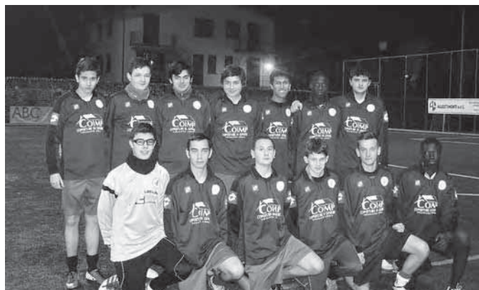
JUNIORES A 11 CSI: 6° CLASSIFICATI