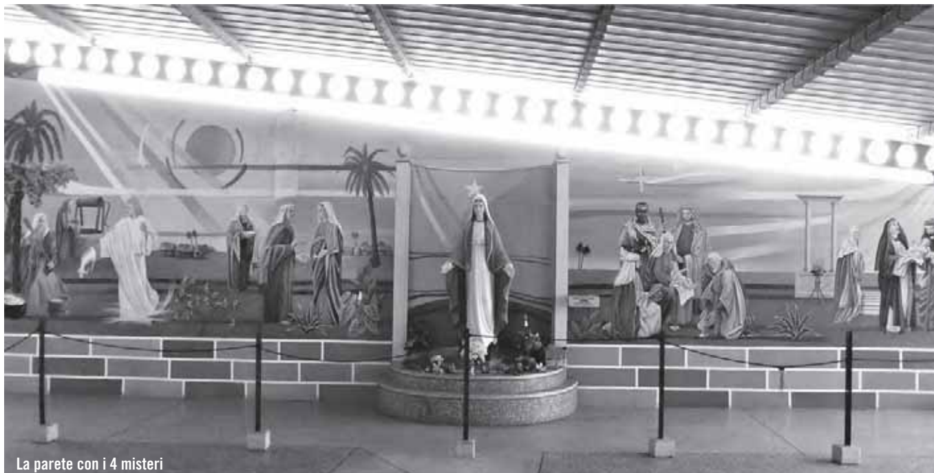
La parete con i 4 misteri