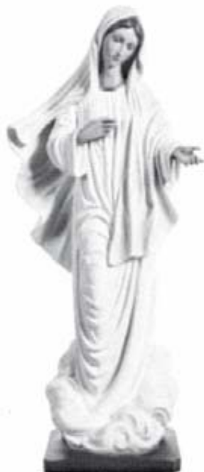
Madonnina di Medugorje

Maria tu eri tutto ascolto... per quanto hai potuto rispondere "sì" alla volontà di Dio. Con Te vogliamo ascoltare la Parola, dacci la tua fede per rispondere "Sia fatto di me secondo la tua Parola"