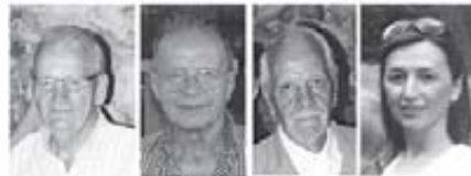
Team artisti telgatesi "quasi in erba"

STUDIO SULLA EVOLUZIONE DI UN'OPERA COME TESTIMONIANZA DI FEDE