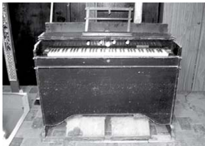
Armonium a pedali di metà 800 (ditta Graziano Tubi di Lecco), usato per le prove della corale fino al 1967. Dismesso coll'avvento delle moderne pianole elettroniche.