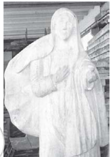
Madonnina, bozza 2011