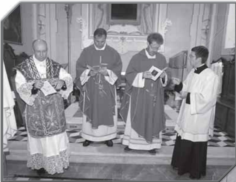
PREPARATIVI DELLA MESSA