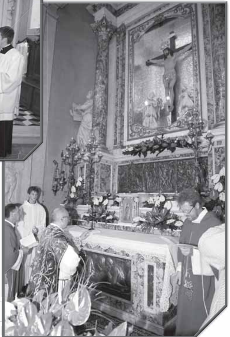
SCOPRIMENTO DEL S. CROCFISSO