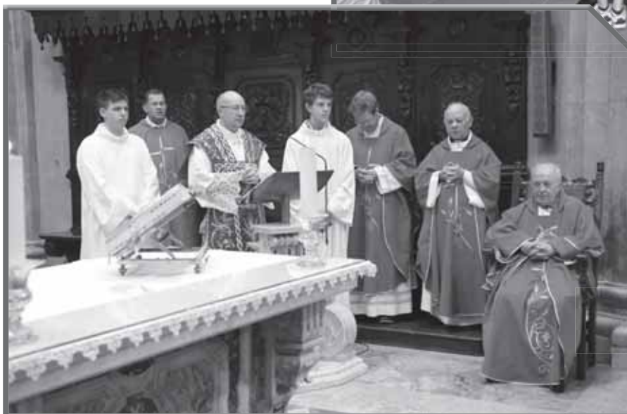
FESTA DELL'ESALTAZIONE DELLA S. CROCE