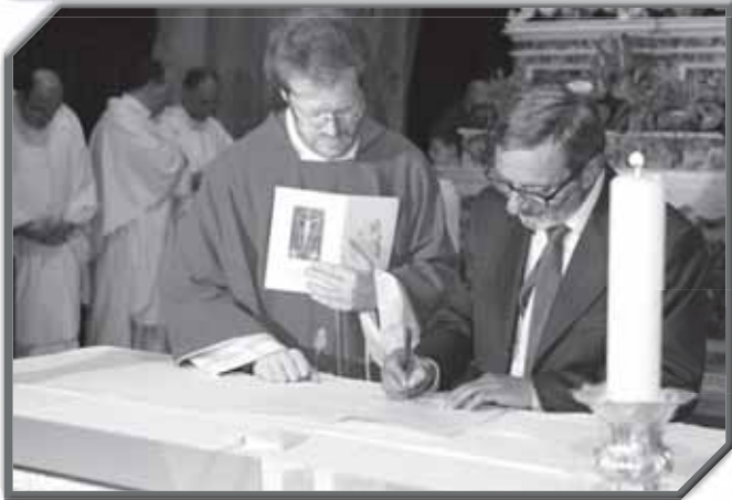
FIRME DELL'ATTO D'INGRESSO