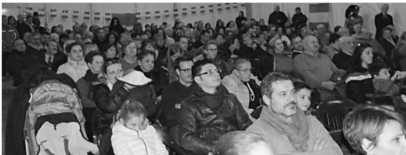
Il pubblico presente assiste allo spettacolo proposto.