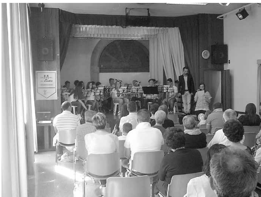
Una performance di Telgate 90 in esecuzione nell'auditorium dell'Oratorio.

Abbiamo partecipato in sfilata ai festeggiamenti del 4 Novembre nel comune di Carvico.