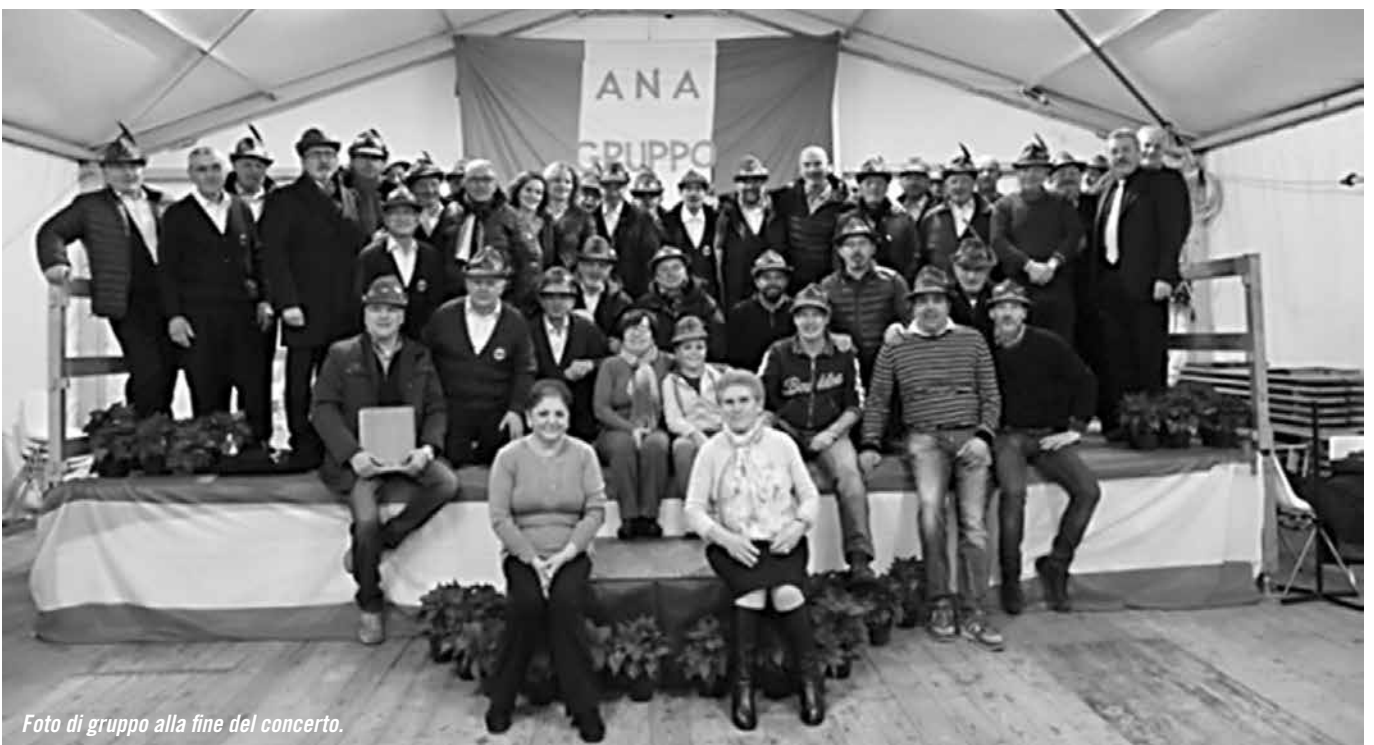
Foto di gruppo alla fine del concerto.