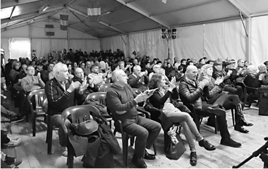
Il numeroso pubblico presente applaude alla fine del concerto.