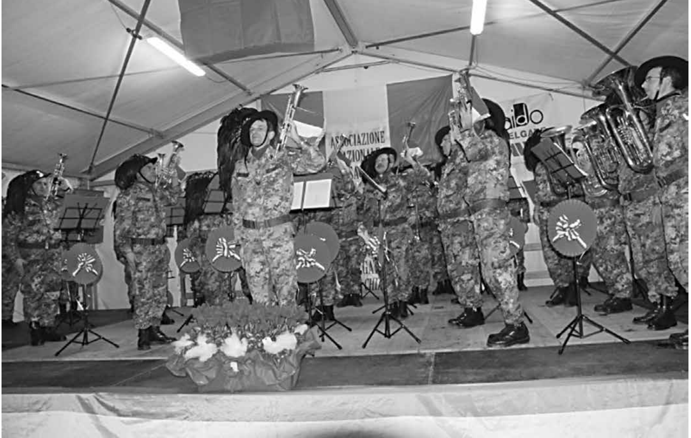
Meritati applausi alla compagine musicale dei Bersaglieri di Lecco.