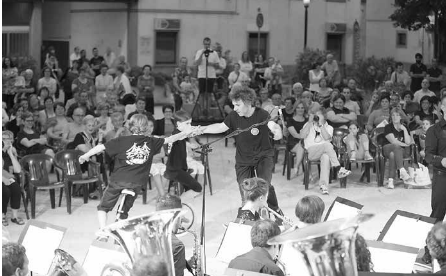
Il concerto della Banda di Telgate 90 eseguito lo scorso 2 giugno in Piazzetta degli Alpini.

Sempre per Telgate abbiamo suonato a 9 manifestazioni promosse da enti ed associazioni che operano sul territorio comunale.