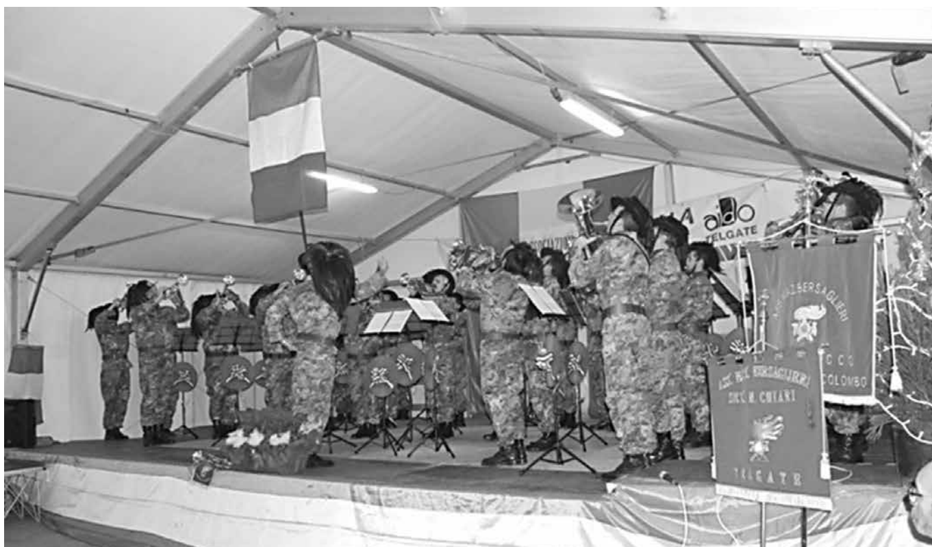
La fanfara G. Colombo di Lecco in piena esecuzione.