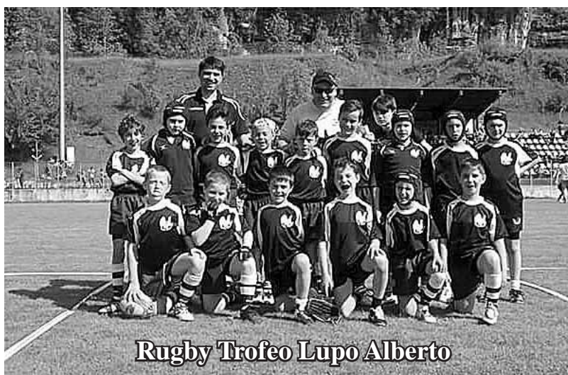
Rugby Trofeo Lupo Alberto

Ricordiamo ad ogni modo che quello che più conta per tutti noi è che i ragazzi del nostro paese vengano a fare attività sportiva, si divertano in un ambiente sano e sereno seguendo i principi educativi basilari del nostro Oratorio.