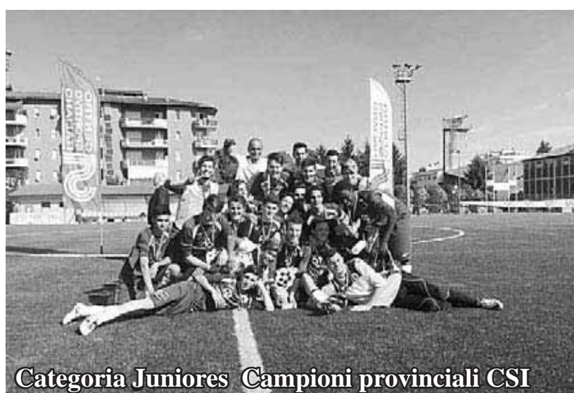
Categoria Juniores Campioni provinciali CSI