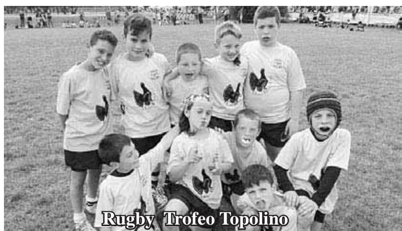
Rugby Trofeo Topolino