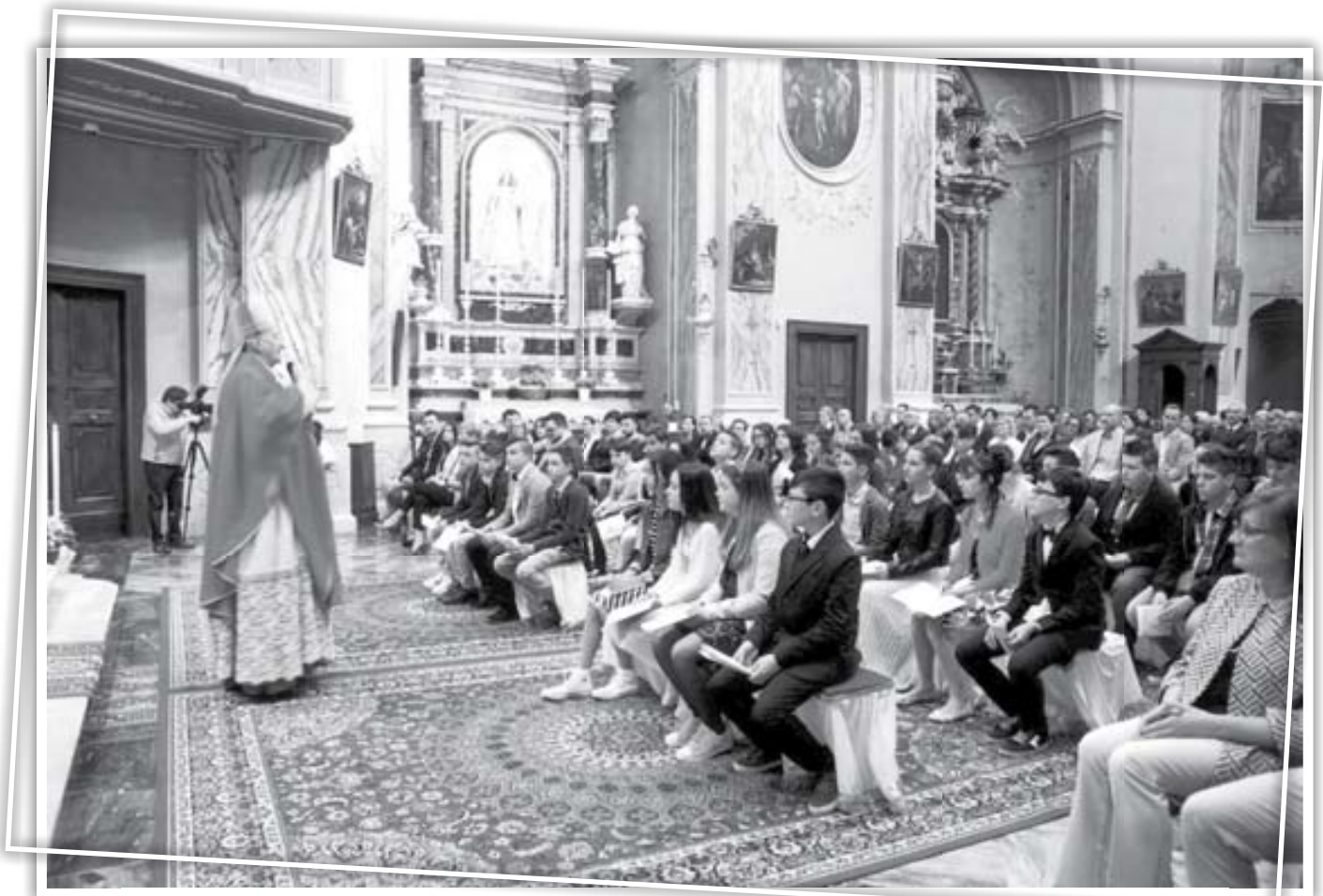
L'Omelia del Vescovo ai cresimandi