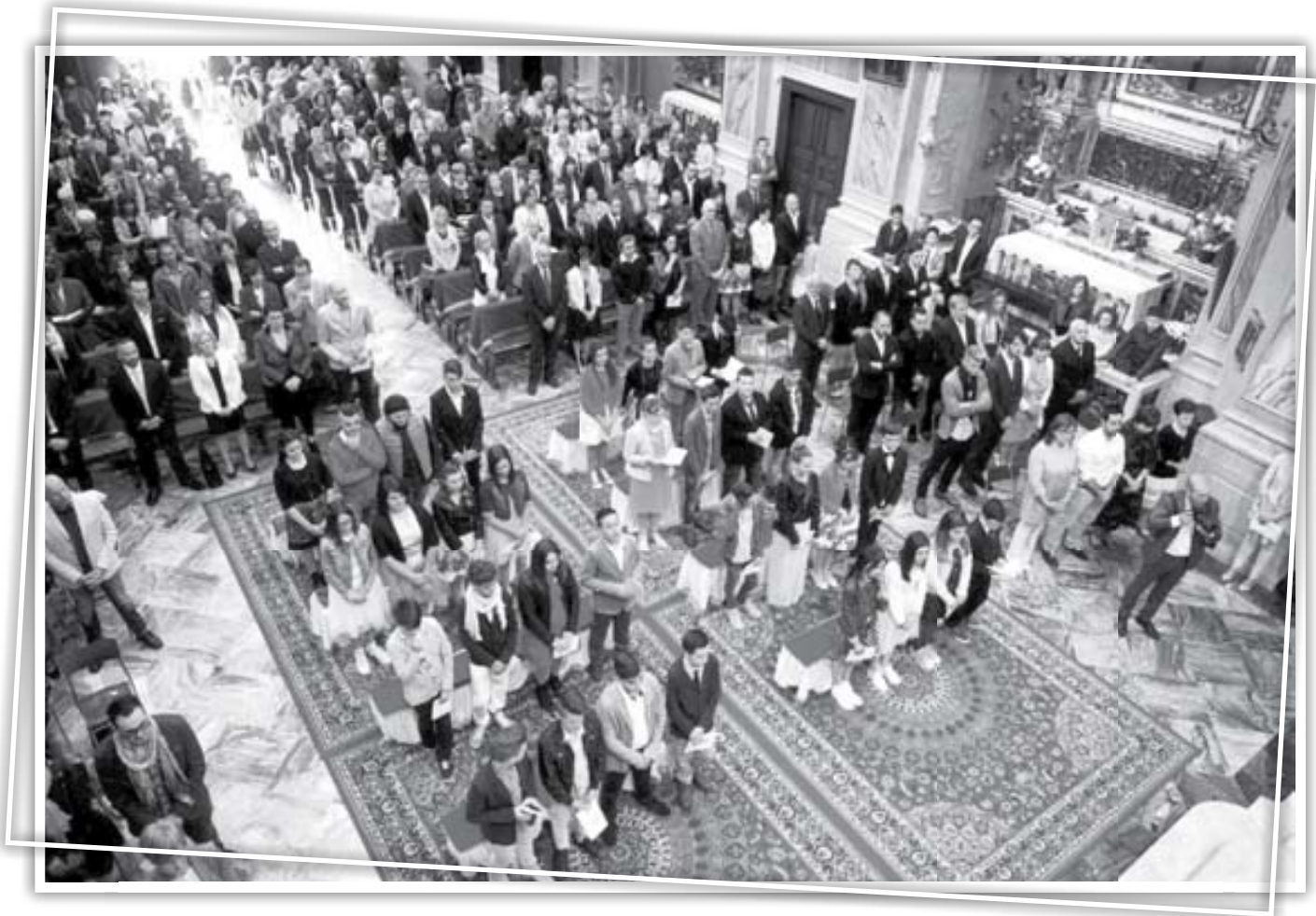
Una panoramica dei ragazzi e dei fedeli