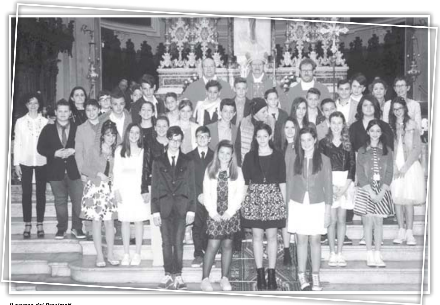
Il gruppo dei Cresimati

La fotocronaca della intera cerimonia prenderebbe da sola una considerevole quantità di pagine del nostro notiziario, ci scusino, pertanto, i nostri lettori se condensiamo in quattro pagine i momenti più significativi della giornata che, siamo certi, segnerà i cuori e le menti dei nostri ragazzi indelebilmente.