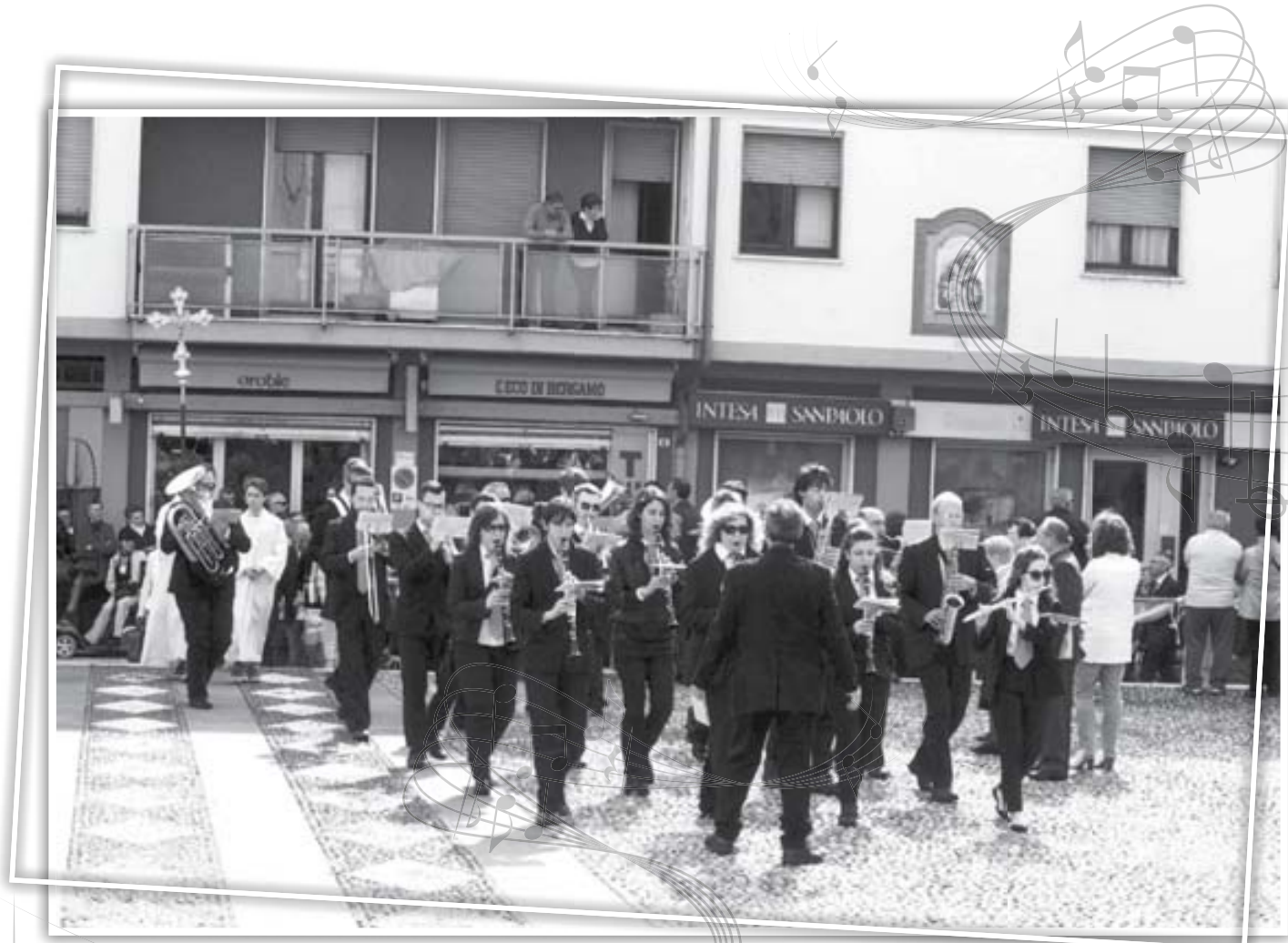
La banda Telgate90 accompagna il corteo