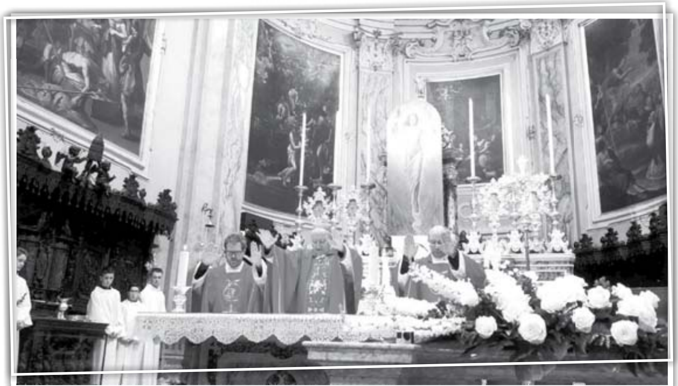
"Vieni Santo Spirito..."