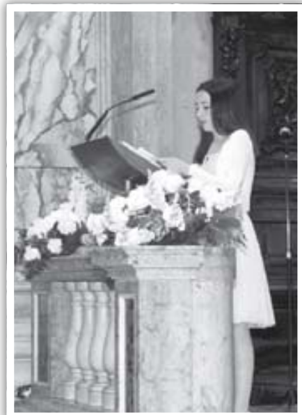
Le preghiere all'Offertorio