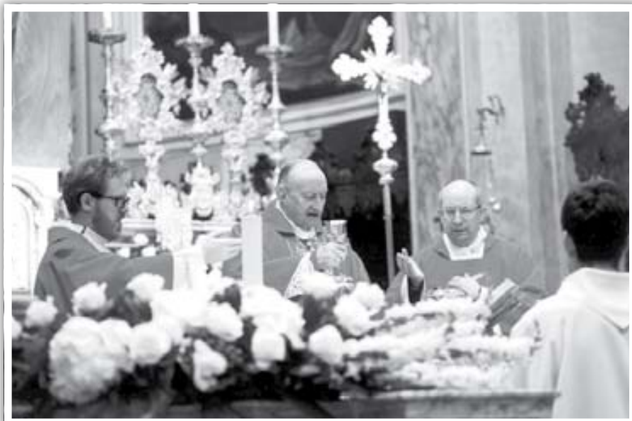
Il momento della consecrazione