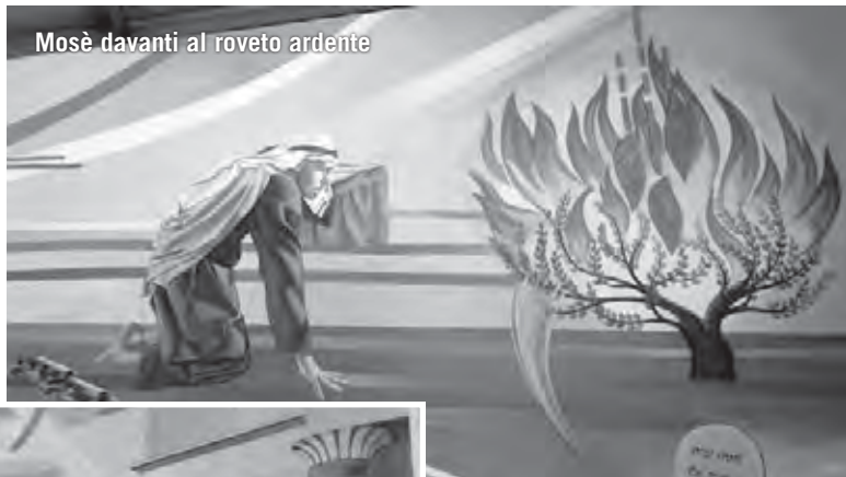
Mosè davanti al rovetto ardente