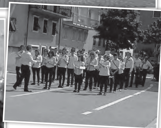
per le strade di Lavis