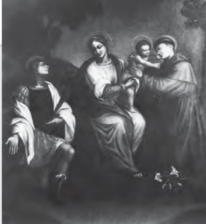
Foto in bianco e nero del quadro di San Giuliano che ornava l'altare dell'omonima chiesetta; andato distrutto dopo il furto avvenuto negli anni '70 dello scorso secolo.

DOMENICA 11 ore 07.30 - S. MESSA in parrocchia ore 09.30 - S. MESSA in parrocchia ore 11.00 - S. MESSA Solenne a S. Giuliano ore 17.30 - S. MESSA a S. Giuliano