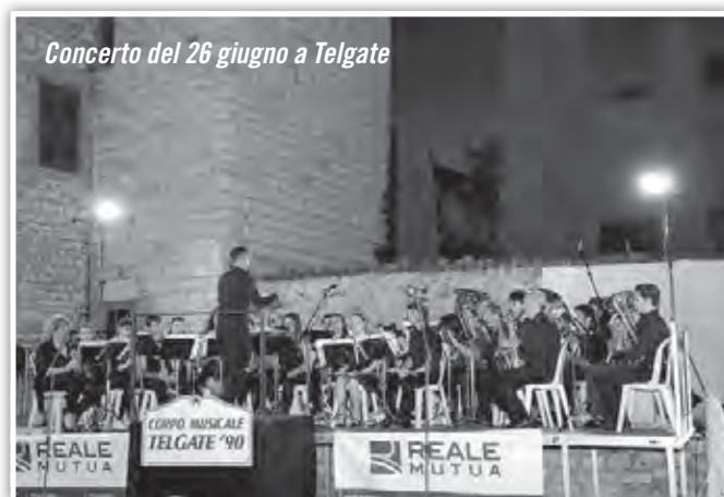
Concerto del 26 giugno a Telgate