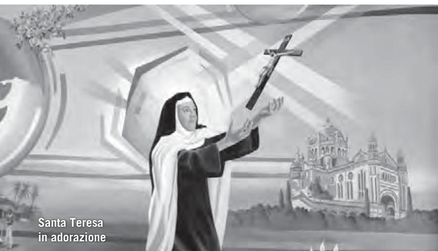
Santa Teresa in adorazione

facevo. I bambini mi chiedevano sempre il cioccolato e io gli davo dei cioccolatini che mi aveva fornito mio nipote Marco rappresentante di una ditta di caffè; li facevo contenti con un cioccolatino. Ho trascorso lì tutto il periodo della Quaresima e anche la Pasqua. Molte iniziative sono state fatte in quel periodo, tra queste il pellegrinaggio dei ragazzi, dei giovani e degli adulti. Anch'io ho partecipato. Con i giovani abbiamo fatto 5 Km raggiungendo il villaggio di Janvo, dove è stata celebrata la S. Messa sotto delle belle piante di anacardi, e poi tanta musica. Con gli adulti abbiamo fatto un percorso di 3 Km raggiungendo un piccolo villaggio. Dopo la messa e il pranzo al sacco ho visitato quelle capanne; mi è sembrato di fare un salto nel passato non so di quanti secoli! Senza corrente, senza niente! Un anziano seduto fuori una capanna tutto raggrinzito, con le radici faceva delle medicine. Sono entrato in una capanna e al buio, per terra su di una stuoia, c'era un neonato tanto piccolo; io l'ho preso in braccio e sono uscito per fare delle foto, era tanto bello. Le persone erano molto cordiali, mi hanno offerto una grappa che loro chiamano cutucu; eravamo in cerchio seduti su degli sgabelli. I bambini mi si avvicinavano, quelli piccoli avevano paura perché non avevano mai visto un uomo bianco. Alla parrocchia S. Papa Giovanni, il venerdì santo nel pomeriggio è stata fatta la Via Crucis animata e si sono concluse le ultime stazioni presso la