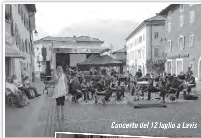
Concerto del 12 luglio a Lavis