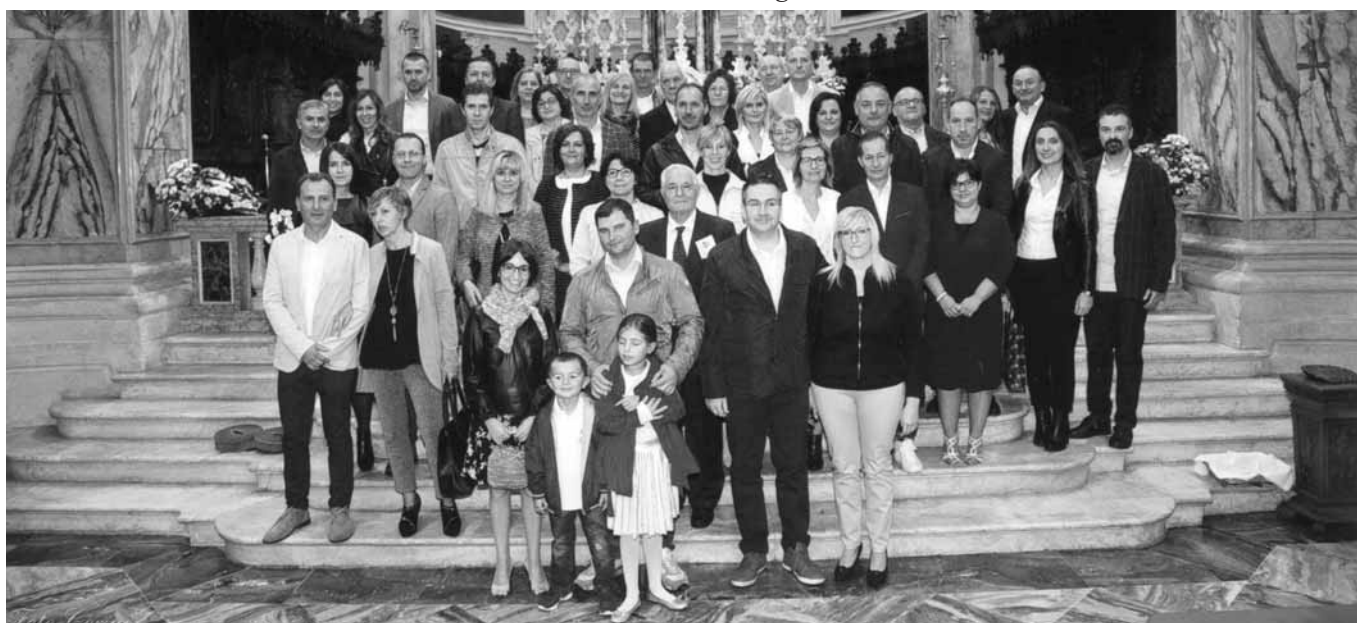
Le coppie che hanno festeggiato l'anniversario dal 5° al 25° di matrimonio