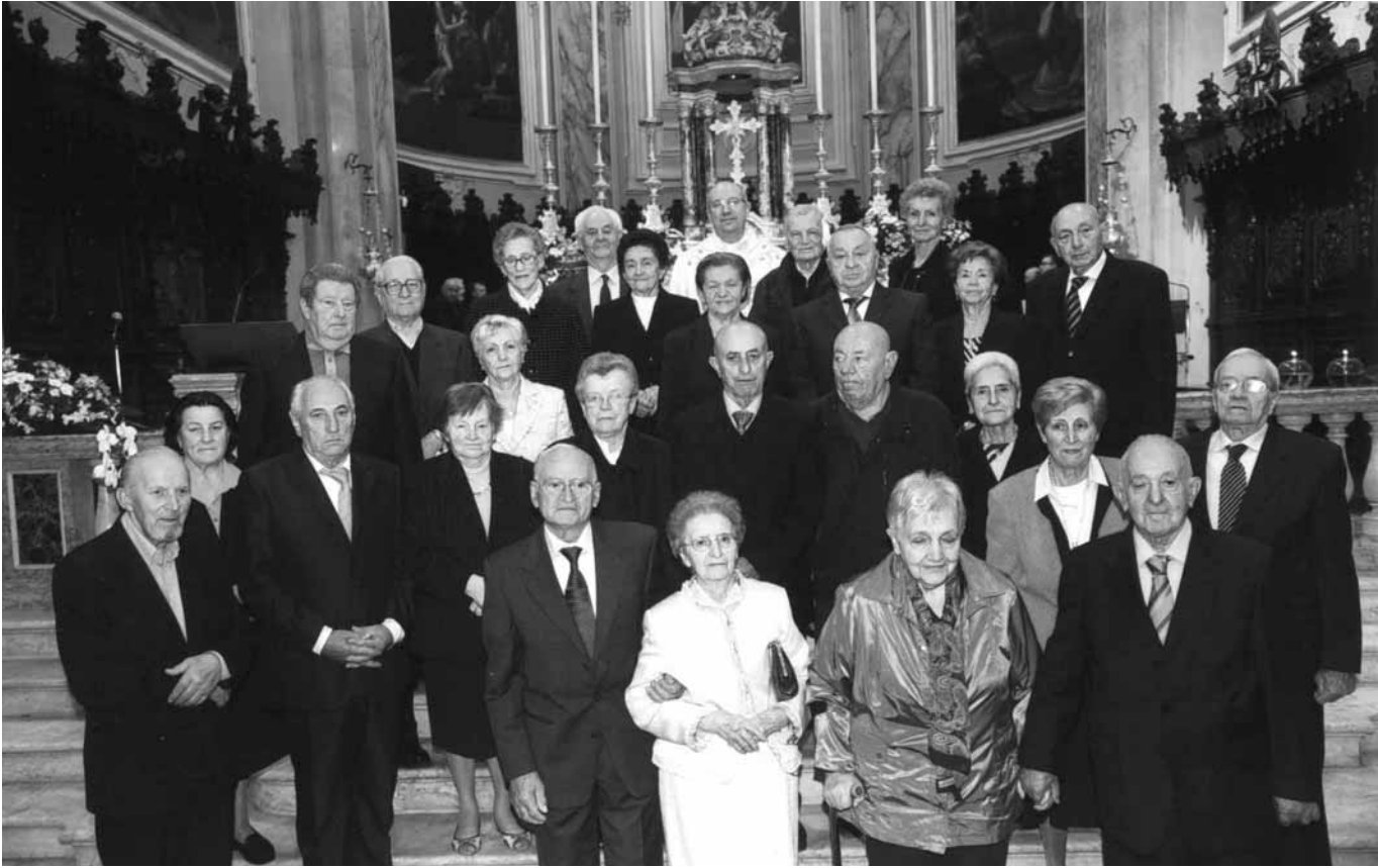
Sempre più numerose le coppie che festeggiano il proprio 50° - 55° - 60° di matrimonio. Tantissimi auguri a tutti.