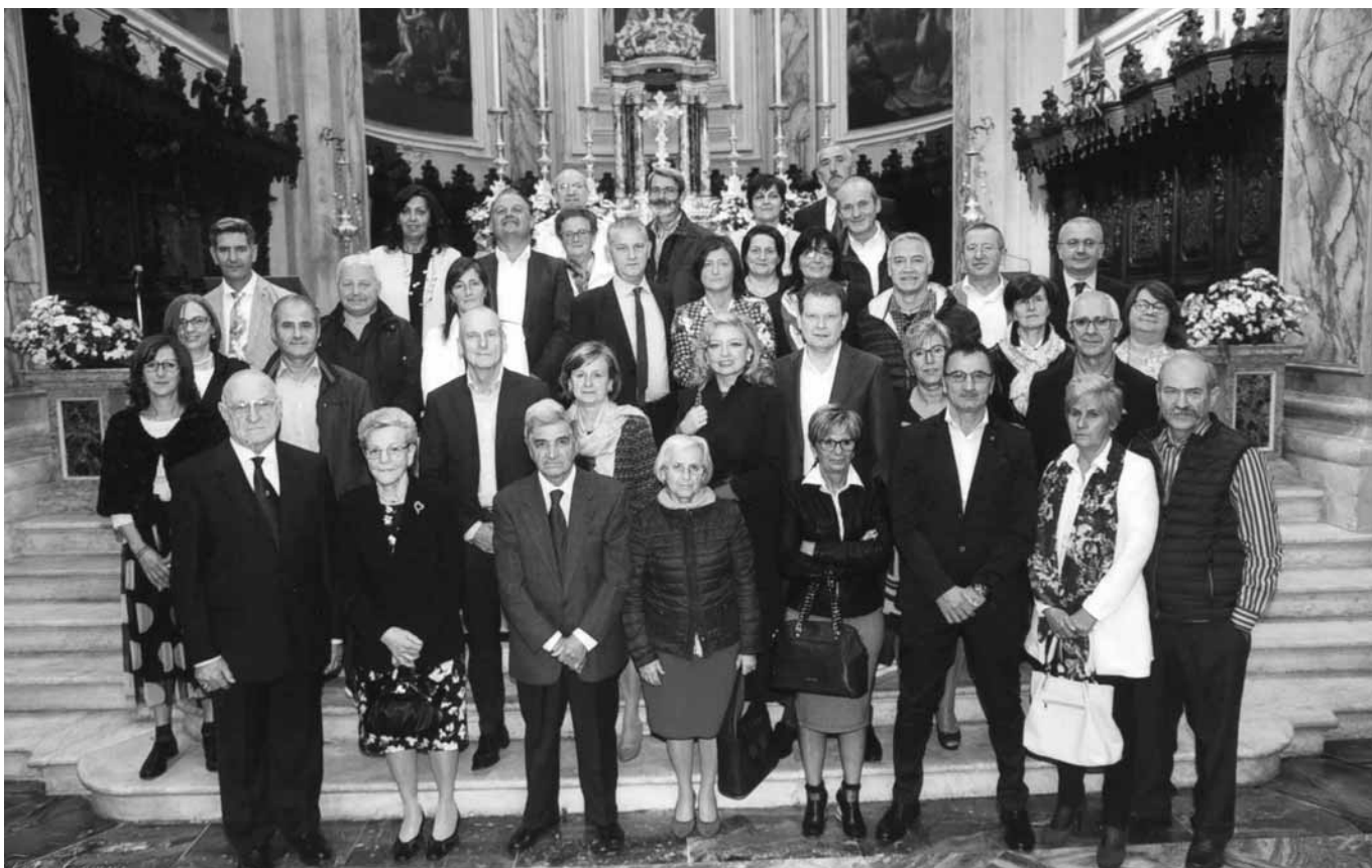
Foto di gruppo per le coppie del 30° e del 35° anniversario di matrimonio