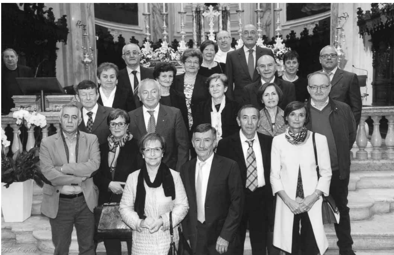
40° e 45° di Matrimonio