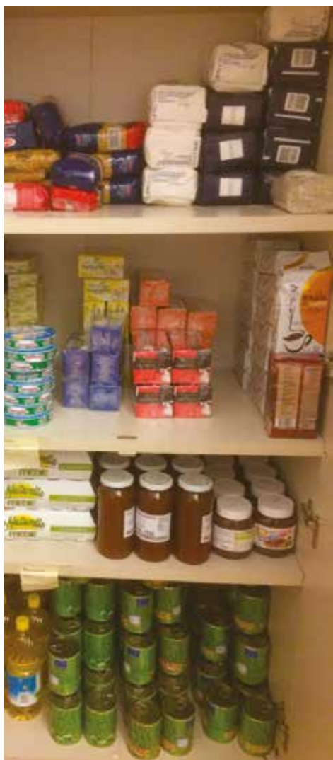
Dispensa dei generi alimentari

Ci teniamo a precisare che quanto operato dalla Madia della solidarietà è svolto in stretta collaborazione con l'assistente sociale in carica nel nostro paese nel rispetto delle vigenti normative.