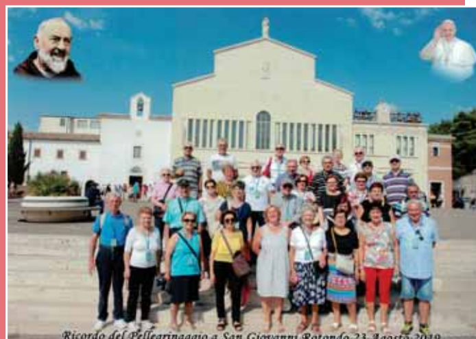
Pellegrinaggio a San Giovanni Rotondo