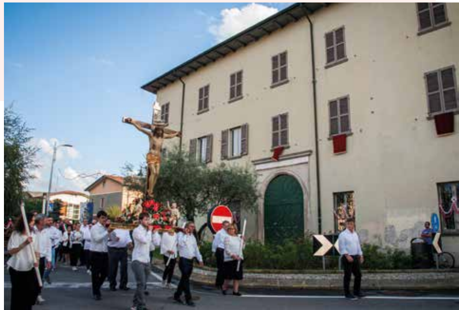
Il S. Crocifisso davanti all'oratorio