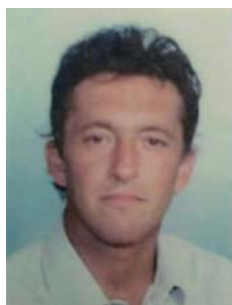
GIOVANNI BELOTTI (GIONNI)