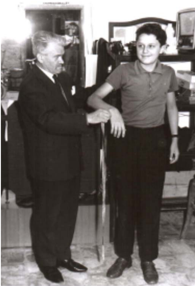
Operazioni preliminari per la confezione di un abito su misura