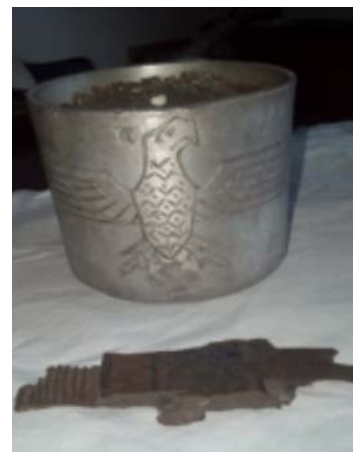
Reperti e ricordi del secondo conflitto mondiale