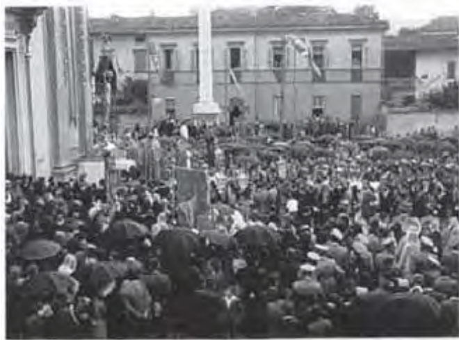
Processione con il SS Crocefisso per ringraziamento da parte dei reduci ritornati dalla guerra; anno 1946

Individuare i componenti di quello che diventerà un glorioso e fecondo sodalizio* della nostra comunità, rimane arduo poiché queste persone raffigurate sono ormai tutte defunte. Tuttavia non disperiamo di riuscire nel tempo a contattare i familiari che vorranno fornire liberamente i nominativi.